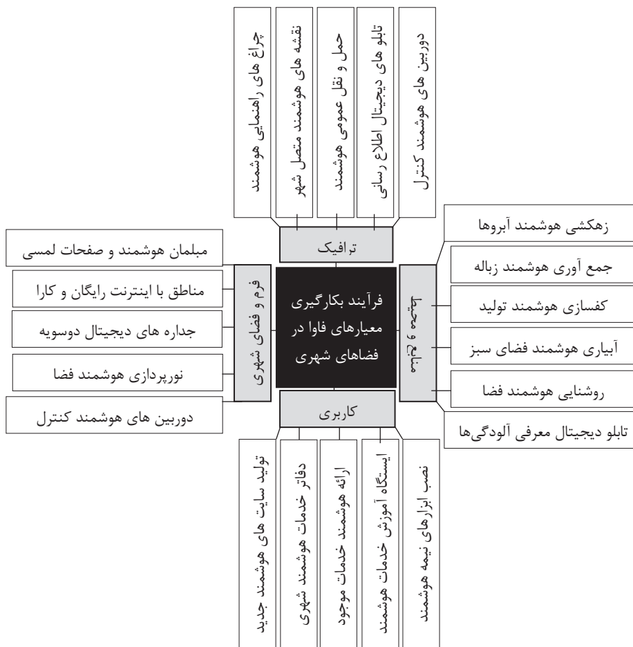
تصویر ۲ - مدل مفهومی پژوهش: معیارها و شاخص‌ها

برخورد با آینده‌نگرانی مهم بشر امروز می‌باشد که در فضای فاوا به بلوغ می‌رسد. این فناوری حتی سنتی‌ترین ویژگی‌های زندگی انسان مثل تعاملات اجتماعی را در خود جای داده است (مویدفر و ضرابی، ۱۳۹۳: ۴۱۰). کاربرد فاوا در آینده شهرها با مشکلات گوناگونی روبرو است. برای مثال، از بعد فنی چالش‌های استانداردسازی، افزایش دقت، صحت و یکپارچگی اطلاعات متنوع در درازمدت وجود دارد و در بعد مشارکت اجتماعی، صلاحیت و پذیرش کارآمد عموم مردم و کارشناسان مد نظر است (green, 2011: 2, 17). فضاهای شهری باید بتوانند با ساکنان خود تعامل کنند و فاوا این مسیر را تسهیل می‌کند. برآیند نظریات فوق، گویای ابعاد مختلف فرایند بکارگیری معیارهای فاوا در فضاهای شهری بویژه پیاده‌راه است، که می‌تواند پشتوانه محکمی برای ورود شهرسازان به چالشی اثرگذار بر کارایی و پایداری شهرها باشد. در همین راستا مدل مفهومی پژوهش مطابق شکل (۲) تنظیم شد.