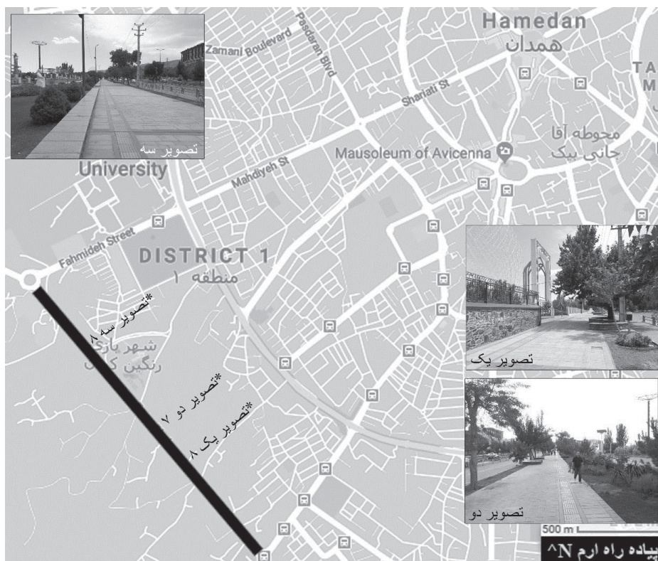
تصویر (۳). موقعیت و تصاویر پیاده‌راه ارم در شهر همدان. ترسیم نگارنده، ۱۴۰۰