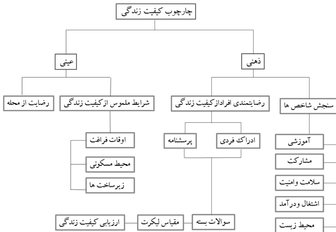
تصویر ۱- چارچوب کلی کیفیت زندگی عینی و ذهنی و روند کار پژوهش

چارچوب مفهومی کیفیت زندگی: قرن‌ها است که مردم به‌طور ذاتی به دنبال یک زندگی خوب بوده‌اند و در این راستا برای بهبود شرایط زیست خود سعی می‌کردند تا از استعداد و توانمندی‌ها و ظرفیت‌های خود، حداکثر بهره‌برداری را بنمایند. ازاین‌رو همواره مسئله اصلی این بوده که زندگی مطلوب و باکیفیت چگونه زندگی است. کیفیت زندگی یکی از رویکردهای نوین درزمینه اصلاح و تکامل توسعه است که در پرتو نفوذ این مفهوم رویکردی جدید در عرصه برنامه‌ریزی شهری شکل گرفته که معتقد است برنامه‌ریزی شهری علاوه بر توجه به اهداف کالبدی باید به نیازهای کیفی مردم شهر پاسخ گوید (سجادی و صدرالسادات، ۱۳۸۸).