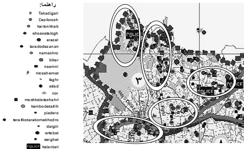
تصویر ۹: نقاط جرم‌خیز محدوده مورد پژوهش

نقاطی که بیشترین معضل را در ناحیه ۳ داشته است با دایره نشان داده شد در این نقاط که سبب بروز جرم شده است برای حل مشکلات راهکارهایی با توجه به علت جرم‌خیزی محدوده مورد مطالعه ارائه داده شده است.