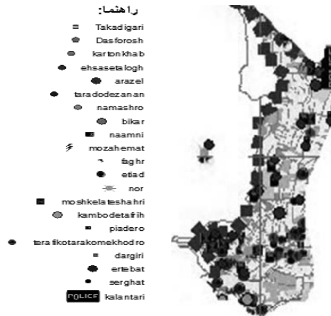
تصویر ۸: نقشه پراکنش انواع جرم در محله گلاب‌دره

در شکل بالا نقاط جرم خیز گلاب‌دره نشان داده شده است همان طور که مشاهده می‌شود در برخی از نقاط محله تجمع چندین معضل در کنار هم وجود دارد.