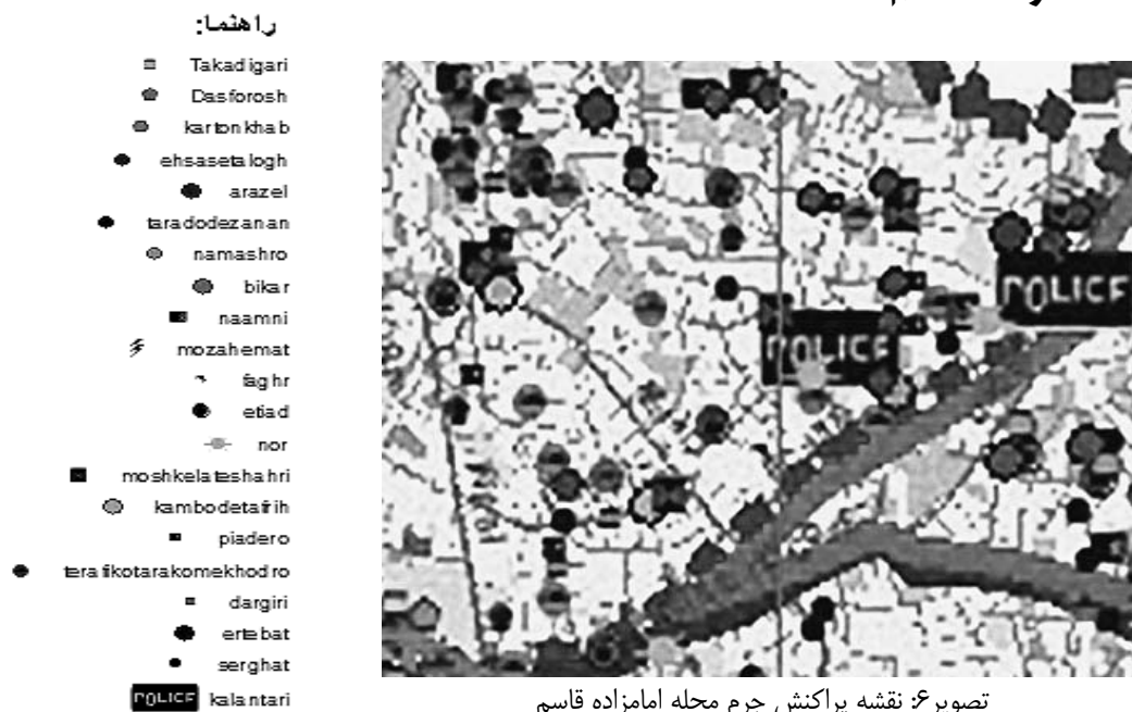
تصویر: نقشه پراکنش جرم محله امامزاده قاسم

در شکل بالا معضلات و کانون‌های جرم خیز محله امامزاده قاسم با توجه به پرسشنامه‌هایی که ساکنان پر کردند شناسایی و در نقشه پراکنده‌اش نشان داده‌شده و طبق جدول زیر میانگین و رتبه هر یک مشخص شد.