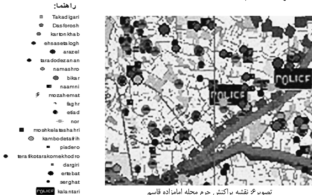
تصویر: نقشه پراکنش جرم محله امامزاده قاسم

در شکل بالا معضلات و کانون‌های جرم خیز محله امامزاده قاسم با توجه به پرسشنامه‌هایی که ساکنان پر کردند شناسایی و در نقشه پراکنده‌اش نشان داده‌شده و طبق جدول زیر میانگین و رتبه هر یک مشخص شد.