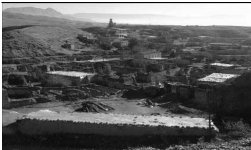
تصویر ۲- نمای کلی از سایت قدیم روستا در دوره دوم، محصور در پایین دست و فضای تحت کنترل (۴۲-۱۳۲۵)