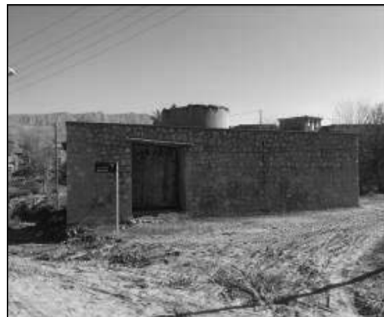
تصویر ۷ و ۸ - استفاده از مصالح بومی و گچ‌بری‌های مسکن در دوره سوم روستای چمگل (۵۷-۱۳۴۲)