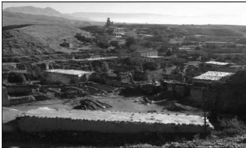
تصویر ۲- نمای کلی از سایت قدیم روستا در دوره دوم، محصور در پایین دست و فضای تحت کنترل (۴۲-۱۳۲۵)