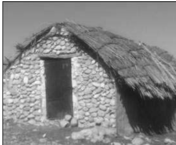
تصویر ۳ و ۴- شکل و نوع مسکن روستایی چمگل در دوره سوم با استفاده از مصالح بومی و روند تحولی آن (۴۲-۱۳۲۵)