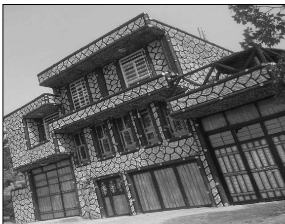
تصویر ۱۳ و ۱۴- مسکن روستایی در چمگل مربوط به دوره ششم با استفاده از مصالح نوین و طرح مدرن (۹۱-۱۳۸۰)