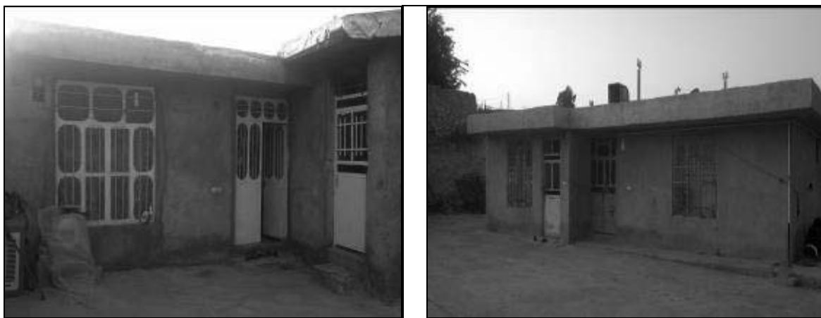
تصویر ۱۰ و ۱۱- مسکن روستایی در چمگل مربوط به دوره چهارم با استفاده از مصالح بلوک و سیمان (۶۸-۱۳۵۷)

این دوره مقارن با پیروزی انقلاب اسلامی و به مدت ۱۱ سال (۱۳۵۷ تا ۱۳۶۸ هجری شمسی) می‌باشد. با پیروزی انقلاب اسلامی و ارائه خدمات از سوی نهادهایی مانند بنیاد مسکن، جهاد سازندگی و فرمانداری به روستاها و همچنین بسط روابط روستانشینان با شهرها و الگوپذیری از این مراکز؛ طرح عمومی منازل مسکونی از حیاط مرکزی به خانه‌های مجتمع تغییر پیدا کرد. به واسطه ارتباطات با دیگر نواحی مسکونی در منطقه همچنین استفاده از خشت محدود و استفاده از گچ و سنگ و تیر آهن فزونی گرفت. ساخت خانه‌هایی با نشیمن ۴ در ۴ در وسط و آشپزخانه ۳ در ۴ در یک سمت و پذیرایی ۳ در ۴ در سمت دیگر رونق پیدا کرد، و پوشش سقف این خانه‌ها از تیر آهن بوده است. (تصاویر شماره ۱۰ و ۱۱). شاید یکی از دلایل عمده این تغییر احساس نیاز به سرمایه‌گذاری و گرمایش توسط وسایل نفت سوز و همچنین جلوگیری از اتلاف حرارت بوده است. همچنین درب و پنجره‌ها نیز از پروفیل‌های آهنی و به صورت شیشه جهت استفاده از نور استفاده می‌شد. در بدنه فضاهای ذکر شده معمولاً طاقچه‌هایی در نظر می‌گرفتند تا برای نگهداری اسباب و اثاثیه مورد استفاده قرار گیرد. در این دوره جهت‌گیری خاصی برای ایجاد منازل مسکونی مد نظر نبوده و بیشتر چیدمان فضایی منازل و جهت‌گیری‌ها بر اساس سایت و مکان مورد استفاده منزل بوده است.