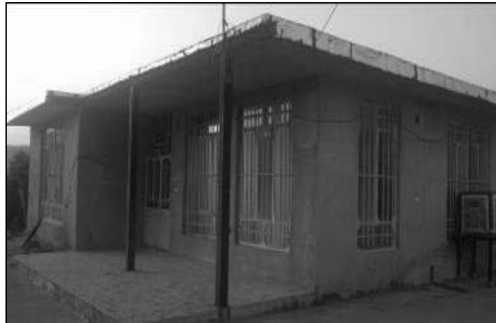
تصویر ۱۲- مسکن روستایی در چمگل مربوط به دوره پنجم با طراحی نسبتاً مدرن (۸۰-۱۳۶۸)

به لحاظ چیدمان فضایی و آرایش درون منازل، فضاهای سرویس بهداشتی و حمام از گوشه‌های حیاط به داخل خانه جابجا شده است. تعداد اتاق‌های خواب به ۲ و ۳ اتاق افزایش یافت و فضای هال ماندنی در وسط منزل جهت دسترسی سریع و آسان به دیگر فضاهای مختلف خانه ایجاد شده است و اتاق‌ها اصولاً دارای درب ورودی و خروجی شدند و فضاهای خصوصی در منزل نمود بیشتری پیدا کرد.