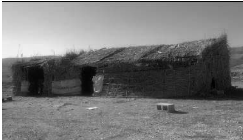
تصویر ۱- نمونه‌ای از کپر (مساکن روستایی) رایج در چمگل در دوره اولیه با مصالح بومی (۲۵-۱۳۱۰)

در این دوره که مدت ۱۵ سال (۱۳۱۰ تا ۱۳۲۵ هجری شمسی) به طول انجامید، اولین گروه به تعداد ۱ الی ۲ خانوار در سال ۱۳۱۰ هجری شمسی در روستای چمگل سکنی گزیدند. سایت انتخابی جهت اسکان توسط این خانوارها بر روی تپه‌ای در شمال غربی بافت قدیم روستا واقع شده است. شغل خانوارهایی که در طی مدت این دوره در روستا ساکن شدند کشاورزی و دامداری بوده است. به همین دلیل و همچنین عدم وجود راه‌های ارتباطی و وسایل ماشینی، عمده مصالح استفاده شده جهت برپایی مسکن و سرپناه از نی، چوب درختان بید، شاخه و ساقه و خار درخت کنار بوده است. (تصاویر شماره ۱ و ۲). به دلیل تعداد کم اعضای خانواده معمولاً از نی و چوب درخت بید «کپر» را برای سکونت احداث و برپا می‌کردند که معمولاً اندازه‌ای در حدود ۳ در ۴ متر داشته است و از درخت «رملک» محدوده‌ی حیاط را تعیین می‌کردند. معمولاً احشام در همین حیاط و در نزدیکی کپر درون آغل (محصور شده از خار) نگهداری می‌شده است. دلیل استفاده از مصالح فوق فراوانی وجود این مصالح در محیط پیرامون روستا بوده است. در این دوره جهت تعیین ورودی محوطه زندگی خانوارها و همچنین ورودی به آغل حیوانات و محل نگهداری دام از شبکه‌ای چوبی که در داخل آن از همان مصالح (خارمانند) پر شده بود، استفاده می‌کردند.