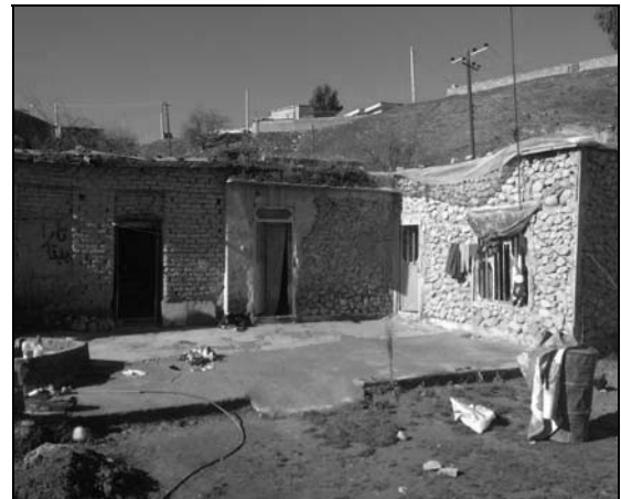
تصویر ۵ و ۶ - مسکن روستایی چمگل در دوره سوم با طراحی حیاط مرکزی و طرح دو طبقه (۵۷-۱۳۴۲)