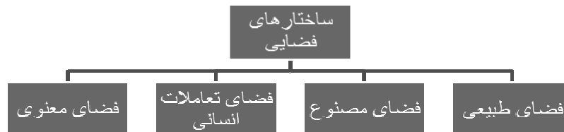
تصویر ۲- نمودار ساختارهای فضایی

خود، فضا را تعریف می‌کند. بالاترین ساحت در فضا، فضای قدسی و مابعدالطبیعه است. فضا در این ساحت، عرصه حضور «وجود عالم امکان» و «موجود» است و عرصه حضور الهی.