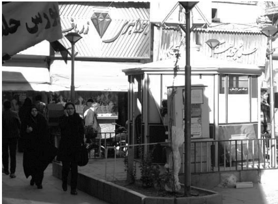
تصویر ۵- ایمنی و امنیت

زمان‌های اوج شلوغی بازار، اذعان داشتند و این مسئله با توافق مالکین و کسبه بازار به ایجاد ایستگاه نیروی انتظامی انجامید که توانست امنیت را برقرار کند.