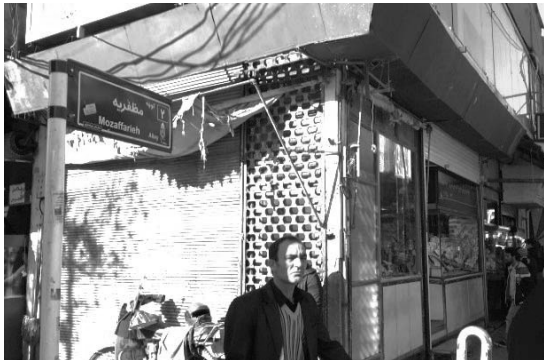
تصویر ۷- عدالت

۶- عدالت (تعادل): واژه‌ای در سطح کلان می‌باشد که شاید بررسی این شاخص در سطح محدوده مورد مطالعه فقط به موضوع پراکنش منطقی و عادلانه کاربری‌ها و خدمات به منظور رفع نیاز عموم افراد معطوف شود که باهدف، می‌توان اذعان نمود که این پراکنش عادلانه در سطح بازار اتفاق افتاده است و پاسخگوی نیاز اکثر افراد با توجه به عملکرد تجاری آن است. بررسی شاخص تعادل نیز جنبه‌های گوناگونی را در برمی‌گیرد که در این بحث فقط به جنبه زیبایی‌شناختی آن در بافت، خصوصاً در جداره‌ها اشاره می‌شود؛ در این رابطه می‌توان گفت که به جهت تراکم بالای برخی ابنیه جدید در بین ابنیه قدیمی با تراکم پایین تفاوت در استفاده از نوع مصالح در بین ابنیه قدیمی و جدید نیز باعث اغتشاش بصری و برهم زنی تعادل بصری شده است.