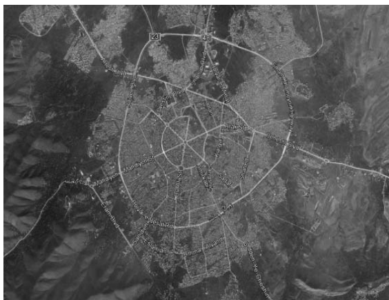
تصویر ۱- عکس هوایی شهر همدان

همدان یکی از شهرهای مهم تاریخی و فرهنگی به شمار می‌رود. این شهر در ۳۶۰ کیلومتری جنوب غربی تهران، در ارتفاع ۱۸۰۰ متری از سطح دریا قرار دارد. شهر همدان دارای عرض شمالی حداقل ۳۴ درجه و ۳۵ دقیقه و حداکثر ۳۵ درجه و ۱۴ دقیقه و طول شرقی حداقل ۴۸ درجه و ۲۰ دقیقه و حداکثر ۴۹ درجه و ۳۰ دقیقه است. شهر همدان به ۵ منطقه و به ۸۴ محله تقسیم شده است. میدان امام خمینی (ره) که در مرکز شبکه‌ی شعاعی شهر همدان قرار گرفته است، شامل ۶ خیابان اصلی است که هر کدام با عرض ۳۰ متر و زاویه ۶۰ درجه نسبت به یکدیگر به شش‌جهت شهر کشیده شده و از ۴ گره (تقاطع) شامل میدان امام حسین (ع)، میدان سپاه، میدان مفتوح و پروانه‌ها و میدان شریعتی و کمان‌های زیادی تشکیل شده است.