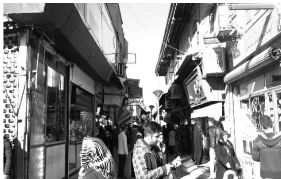
تصویر ۶- عدالت