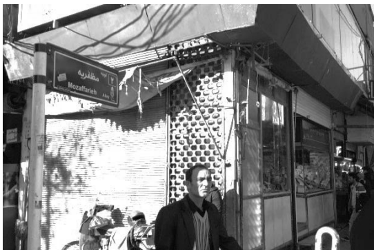
تصویر ۷- عدالت

۶- عدالت (تعادل): واژه‌ای در سطح کلان می‌باشد که شاید بررسی این شاخص در سطح محدوده مورد مطالعه فقط به موضوع پراکنش منطقی و عادلانه کاربری‌ها و خدمات به منظور رفع نیاز عموم افراد معطوف شود که باهدف، می‌توان اذعان نمود که این پراکنش عادلانه در سطح بازار اتفاق افتاده است و پاسخگوی نیاز اکثر افراد با توجه به عملکرد تجاری آن است. بررسی شاخص تعادل نیز جنبه‌های گوناگونی را در برمی‌گیرد که در این بحث فقط به جنبه زیبایی‌شناختی آن در بافت، خصوصاً در جداره‌ها اشاره می‌شود؛ در این رابطه می‌توان گفت که به جهت تراکم بالای برخی ابنیه جدید در بین ابنیه قدیمی با تراکم پایین تفاوت در استفاده از نوع مصالح در بین ابنیه قدیمی و جدید نیز باعث اغتشاش بصری و برهم زنی تعادل بصری شده است.