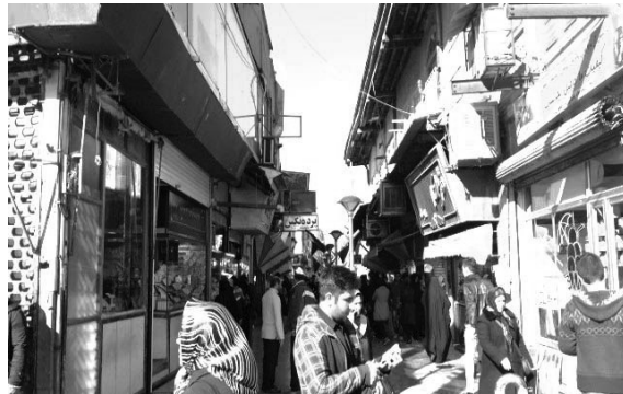
تصویر ۶- عدالت