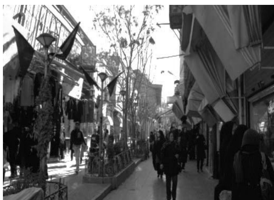
تصویر ۴- مشارکت و تعاملات اجتماعی

۵- ایمنی و امنیت (آسایش و آرامش): به دلیل عبور و تردد سواره از این بازار، عمدتاً تداخل سواره با پیاده اتفاق می‌افتد که این موضوع ایمنی عابران را به خطر می‌اندازد و آسایش و آرامش که از مشخصه‌های اصلی یک فضای شهری مطلوب است را از بین می‌برد. شاخص امنیت را باید هم در زمان روز و هم در شب بررسی نمود؛ محدوده مورد مطالعه به جهت کاربری تجاری غالب یعنی طلافروشی معمولاً در ساعات خلوت و نیمه فعال از امنیت کمتری برخوردار بود در مصاحبه‌های صورت گرفته، برخی افراد، به‌اتفاق افتادن سرقت در