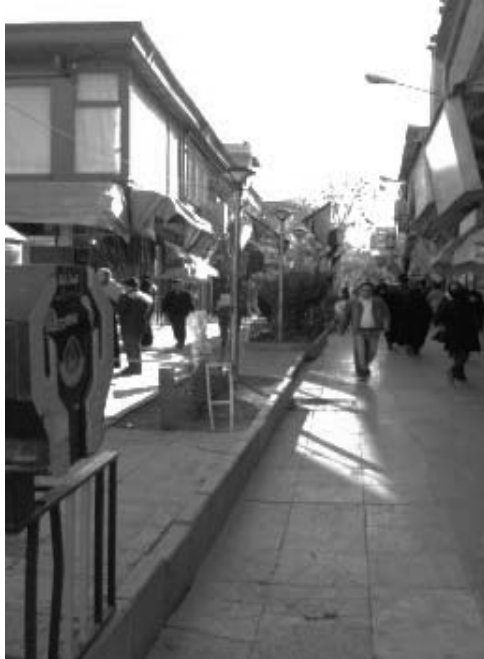
تصویر ۲- مقیاس انسانی

۱- مقیاس انسانی: رعایت شاخص مقیاس انسانی، یعنی طراحی و برنامه‌ریزی بر اساس عامل انسان. بافت مورد مطالعه، بافتی قدیمی است که اغلب ساختمان‌های موجود با رعایت اصول معماری و شهرسازی ایرانی- اسلامی، رعایت شاخص مقیاس انسانی را نیز در پی داشته‌اند و این جز اصلی‌ترین ویژگی بارز این راسته به شمار می‌آید.