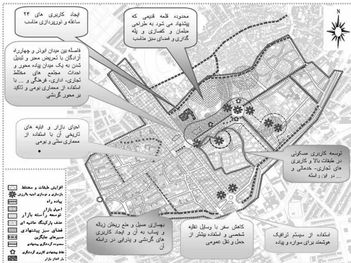
شکل ۲: احیا محدوده مرکز شهر با استفاده از رشد هوشمند شهری

هدف این پژوهش، بر مبنای اصلاح رویکرد ساز و کار برنامه ریزی و سیاست گذاری شهری و فرآیند تولید برنامه ویژه فضاهای موجود شهری از طریق معرفی و به کارگیری رویکرد رشد هوشمند شهری و همچنین در نظر گرفتن بعد مرکزی و تاریخی نمونه موردی (شهر نهاوند) در به کارگیری ساز و کار برنامه ریزی تجدید حیات شهری تدوین گردید. همچنین در این پژوهش اهداف برنامه تجدید حیات شهری ناحیه مرکزی شهر نهاوند شامل اهداف برگرفته از برنامه تجدید حیات شهری بر اساس رویکرد رشد هوشمند می باشد. راهبردهای برنامه از درون اهداف استخراج گردیده و اهداف به عنوان معیار برای تداوم/پیوستگی راهبردها در گام های بعدی مورد استفاده قرار گرفته در نهایت راهبردهای بدست آمده بر اساس سیاست های مدنظر رشد هوشمند به برنامه های عمل برای احیای مرکز شهر نهاوند منتج خواهد شد.