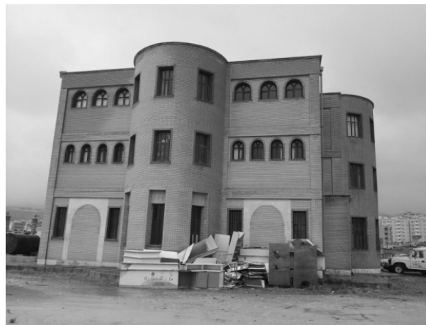
تصویر ۱- کانون فرهنگی کودک و نوجوان شهر ایلام

با توجه به مدل تحقیق شکل (۱) و (۲) که سطح معنی‌داری تأثیر عوامل محیطی و سپس فضای سبز از دیدگاه معماری و امنیت و کنجکاوی را از دیدگاه خلاقیت جز مهم‌ترین عوامل معرفی می‌نماید. لازم به ذکر است با توجه به بازدهی‌های متعدد از کانون پرورش کودکان شهر ایلام همچون کمبود رنگ فضاها، نمایشگاه، موزه، کارگاه، کتابخانه و کمبود فضای سبز مناسب از مهم‌ترین نیازهای کودکان در ارتقا خلاقیت آنها در مدل نشان داده شده است.