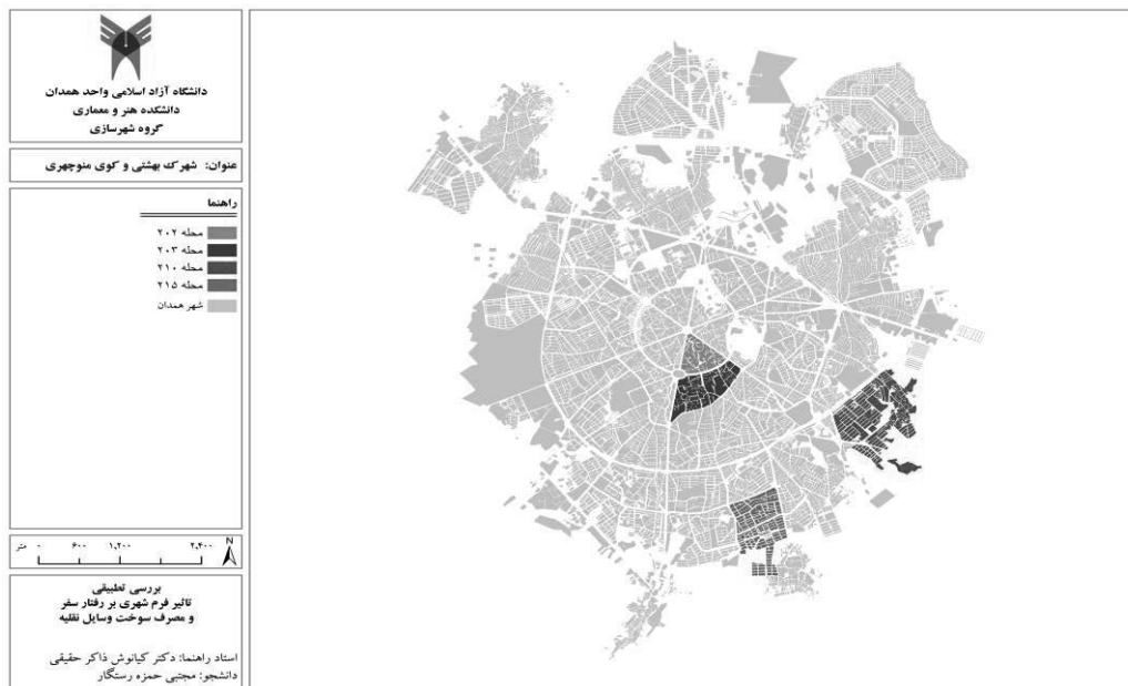
تصویر ۲- موقعیت جغرافیایی محلات مورد مطالعه در شهر همدان

موقعیت جغرافیایی محله ۲۱۰ (شهرک بهشتی): این محله در جنوب شرقی شهر همدان و در جنوب بلوار شهید مطهری واقع شده است؛ و از نظر تقسیمات شهری این محله در درون منطقه دو شهرداری همدان قرار دارد و شامل محله ۲۱۰ می‌گردد. محله ۲۱۵ (شهرک شهید چمران): این محله در جنوب شهر همدان واقع شده است و از شرق به بلوار محمدیه از غرب به بلوار اعتمادیه و از سمت شمال به بلوار شهید رنجبران محدود است. این محله از سویی با املاک محمدیه، از سمت جنوب به وسیله باغات، محدود شده است.