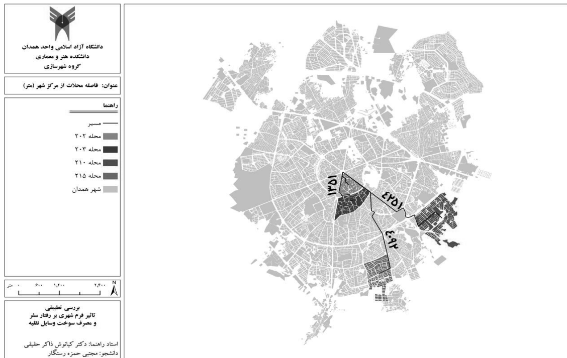
تصویر ۳- فاصله محلات مورد مطالعه از مرکز شهر همدان