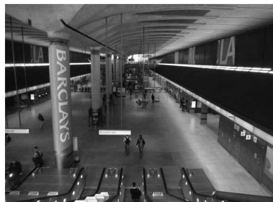
تصویر ۹ و ۱۰- رؤیت‌پذیری فضا از طریق شفافیت و خوانایی نظام حرکتی و وجود علائم و نشانه‌های راهنما

مترو و اجتماع‌پذیری: مترو ابزار حمل‌ونقل سریع‌السیری است که تمام یا بخشی از آن در زیرزمین ساخته شده و از طریق یک یا چند مسیر مشخص که همه دارای ایستگاه‌های ثابت و قابل دسترسی از سطح زمین هستند امکان جابجایی مسافران را در داخل شهر فراهم می‌سازد (رضازاده، ۱۳۸۲) و از آنجاکه کمترین تداخل را با سیستم حمل‌ونقل شهری داراست، دارای سرعت و سهولت بالایی در جابجایی بوده و بیشترین حجم مسافر را به خود اختصاص داده است.