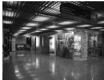
تصویر ۷ و ۸- تنوع در کاربری‌های موجود در ایستگاه مترو و وجود مبلمان انگیزاننده توقف