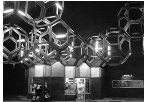
تصویر ۱ و ۲- خلاقیت در زیباسازی شکل سقف