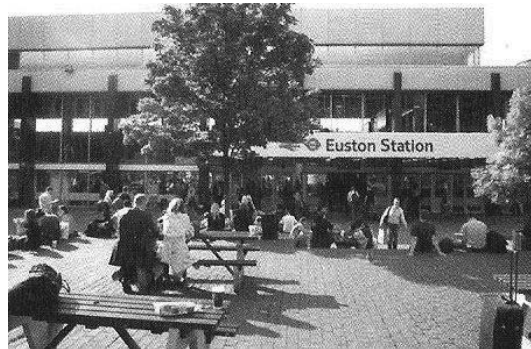
تصویر ۵ و ۶- نمونه‌ای از برقراری تعاملات اجتماعی در ایستگاه مترو

قابلیت‌های عملکردی مرتبط با اجتماع‌پذیری فضا: عوامل عملکردی شامل عواملی است که در نوع خود تسهیل‌کننده روابط کارکردی فضا و سبب خوانایی و شفافیت بیشتر فضا در جهت ادراک بهتر کاربران خواهند شد و نهایتاً در ایجاد شرایط مساعدتر آسایش و امکان برقراری ارتباط و تعاملات بیشتر و کارا تر کاربران با فضا مؤثر واقع می‌شوند. از این منظر، طراحی ایستگاه مترو از نگرش عملکرد گرا تبدیل به جستجوی بستری برای شکل‌گیری روابط اجتماعی شهروندان و ایجاد فضای عمومی متناسب با زندگی جمعی و روحیه کاربران ایستگاه می‌شود (Pace & et al, 2007: 11). از جمله این عوامل می‌توان به مکان‌یابی، قرارگیری کاربری‌های مختلف در کنار هم برقراری ارتباط صحیح با تمام بنا، جهت‌یابی آسان، طراحی و جانمایی مبلمان، مسیرها و دسترسی‌ها، نمادها و نشانه‌ها، نور، دما و صوت اشاره کرد.