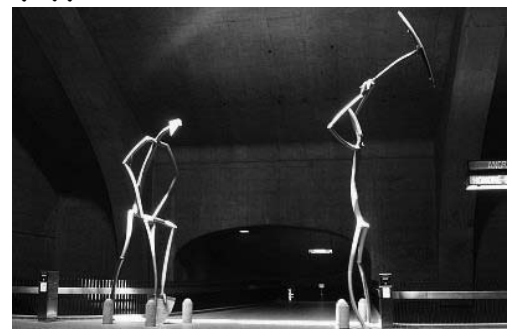
تصویر ۳ و ۴- وجود آثار هنری و برایی نمایشگاه در ایستگاه مترو