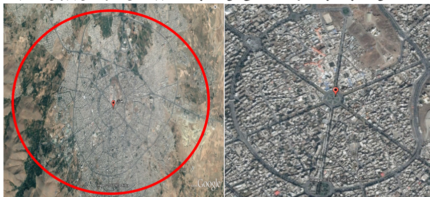
تصویر ۲- موقعیت شهر همدان

محدوده مورد مطالعه، به واسطه دربرداشتن بافت قدیم شهر اهمیت ویژه دارد. بافت مرکزی شهر توسط بلوار آیت‌الله کاشانی، آیت‌الله مدنی، دکتر مفتاح، بلوار هگمتانه و خیابان‌های شهدا و خضریان محصور شده است و توسط خیابان‌های بوعلی، تختی، شهدا، اکباتان، باباطاهر و شریعتی به شش قطاع دایره تقسیم شده است که هریک از این قطاع‌ها دارای ویژگی‌های خاصی است و هر کدام از این قطاع‌ها از تعدادی محله به نام‌های محله کباییان، کولانج، ذوالریاستین، حاجی، قاشق تراش‌ها، ملاجلیل، کلیمی‌ها و ... که به دلیل قدمت از اهمیت خاصی برخوردار است، تشکیل شده است. بررسی محدوده فوق نشان می‌دهد بخش عمده فعالیت‌های تجاری شهر همدان در محدوده مرکز شهر و بازار قرار دارد و به عبارت دیگر این محدوده قلب اقتصادی شهر محسوب می‌شود عمده فعالیت‌های مرکز شهر همدان مربوطه به کاربری‌های تجاری و سپس مسکونی است. مهم‌ترین عامل زوال و انحطاط این فعالیت‌ها ناشی از جابه‌جایی جمعیت و ایجاد مراکز تجاری مدرن و وجود ناهنجاری‌های اجتماعی در این محدوده است که از لحاظ اقتصادی نیز در حال ضربه به واحدهای تجاری است. در بهترین راهکار برای حل مشکلات این محدوده تقویت سرمایه اجتماعی این محدوده است (مهندسین مشاور نقش پیراوش، ۱۳۸۷).