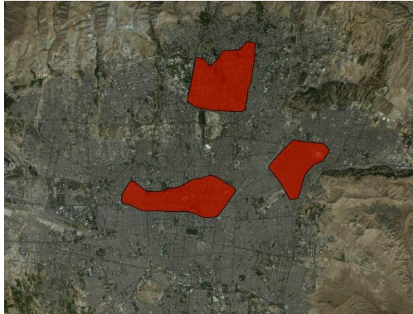
شکل ۱ - قسمت‌هایی از شهر تهران که پرسشنامه‌ها جمع‌آوری شده است

تعریفی در مقیاس شهر مرکزی و حومه هایش، اعم از مرفه و نامرفه؛ و تعریفی در مقیاس جهانی. تهران بر آن است که خود را در زمان حال تعریف کند؛ گذشته او دنیای دیگری است. شکی نیست که حال آن از گذشته اش نشأت می گیرد ولی این حال دگرذیسی یافته واز جنس دیگر است و نگاهی متفاوت را می طلبد.