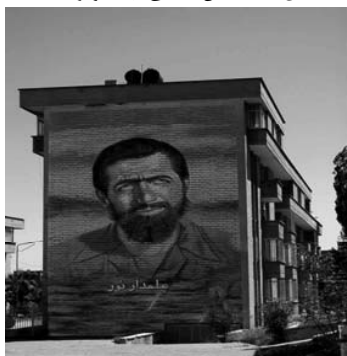
شکل ۱۵: نقاشی دیواری میدان امام زاده عبدا...