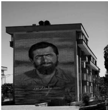
شکل ۱۵: نقاشی دیواری میدان امام زاده عبدا...