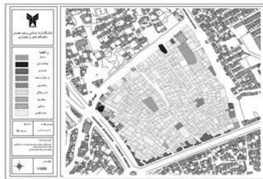
شکل ۲. کاربری اراضی وضع موجود محله جولان همدان

الف) سرانه کاربری‌ها: با توجه به نقش اصلی محله جولان جنوبی که همواره سکونت در آن بخش غالب فعالیت را به خود اختصاص داده است، خدمات پشتیبانی سکونت درصد کمی از بافت را شامل می‌شود که این اراضی عمدتاً در لبه محورهای پیرامونی بافت قرار گرفته‌اند. فعالیت مذهبی که با حضور مساجد و حسینیه‌ها در درون محله متجلی شده است در نقاط متعددی هم در درون و هم پیرامون محله استقرار یافته‌اند. بر این اساس جدول زیر سطوح و زیربنای کاربری‌های موجود در حوزه محلی را نشان می‌دهد.