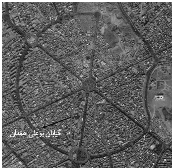
شکل ۱: موقعیت خیابان بوعلی در شهر همدان

محدوده مورد مطالعه خیابان بوعلی است که در بخش مرکزی شهر همدان و بافت قدیم آن واقع شده است (شکل ۱). کارل فریش طراح ساختار شعاعی اولیه این شهر است. این ساختار متشکل است از میدان مرکزی امام خمینی و شش خیابان شعاعی منشعب از آن که یکی از این خیابان‌ها، خیابان بوعلی پایین است که از میدان امام شروع شده و در انتها به میدان بوعلی ختم می‌گردد (خیابان بوعلی بالا نیز از میدان بوعلی شروع شده به سمت میدان جهاد ادامه دارد و البته مقصود این پژوهش خیابان بوعلی پایین است). طول این خیابان حدود ۷۰۰ متر و عرض آن به طور متوسط ۳۰ متر است. این خیابان یکی از خیابان‌های اصلی و پرتردد تجاری، خدماتی و درمانی شهر همدان است. وجود ساختار شعاعی موجود در هسته مرکزی شهر بار ترافیکی زیادی را بر این محدوده تحمیل کرده و تردد پیاده را با مشکلات زیادی مواجه گردانیده است. البته در سال‌های اخیر اقداماتی جهت پیاده‌راه‌سازی این محور توسط مسئولان شهری مانند احداث آب‌نمای طولی در مرکز خیابان، عدم اجازه تردد خودرو در ساعاتی از شبانه‌روز و یا محدود نمودن عبور خودروها به‌جز تاکسی و اقداماتی از این قبیل صورت گرفته است؛ ولی متأسفانه این محور هنوز تا تبدیل شدن به یک محور پیاده کامل فاصله بسیاری دارد.