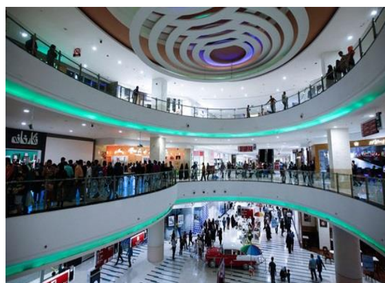
تصویر ۲- مجموعه تجاری - تفریحی سیتی سنتر (سمت راست) و ارگ جهان نما (سمت چپ)

سیتی سنتر اصفهان دارای عملکردهای تجاری، تفریحی، خدماتی و توریستی است. تأمین نیاز شهروندان به عنوان یکی از اهداف اصلی این مگاپروژه ذکر گردیده است. ساختمان این مگا پروژه دارای هفت طبقه، شامل دو طبقه پارکینگ، سه طبقه مرکز خرید و دو طبقه مجموعه فرهنگی تفریحی می باشد. ارگ جهان نما فعالیت های تجاری، اداری و فرهنگی را در خود جای داده است. پیوند تاریخ و گذشته اصفهان با مقتضیات و نیازهای روز شهروندان از اهداف مهم این پروژه ذکر شده است.