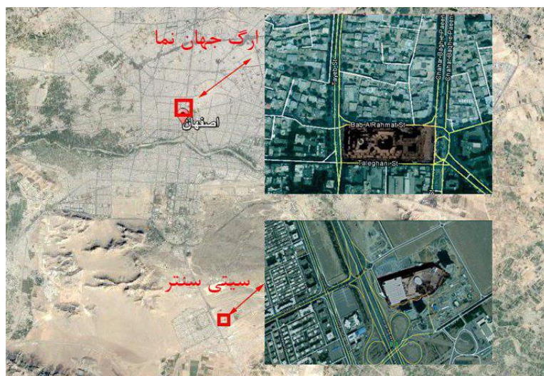
تصویر ۱- موقعیت مجتمع تجاری ارگ جهان نما و سیتی سنتر در شهر اصفهان

ارگ جهان نما و سیتی سنتر در کلانشهر اصفهان واقع شده اند. کلانشهری که در سال های اخیر با رشد و گسترش روزافزونی مواجه بوده است به طوریکه در سرشماری نفوس و مسکن سال ۱۳۹۵، جمعیت آن به حدود دو میلیون نفر رسیده است. این تمرکز جمعیت موجب شکل گیری نیاز ها، سلیقه ها و منافع مختلفی شده است. در راستای پاسخ به این نیاز ها و منافع و سلايق، یکی از پدیده های نوظهور در شهر که مگاپروژه ها هستند در این کلانشهر نیز ظهور کرده است. هر دو پروژه به لحاظ زمان، هزینه ساخت و وسعت اثرگذاری، ویژگی های یک مگاپروژه را دارا هستند. ارگ جهان نما در مرکز کلانشهر اصفهان و سیتی سنتر در خارج از محدوده شهر واقع شده اند (تصویر ۱). هر یک از این پروژه ها از ویژگی هایی برخوردارند که موجب اثرگذاری بر رضایت و یا عدم رضایت استفاده کنندگان از فضای هر یک شده است. اگرچه هر یک از دو مگامال دو رویه متفاوت را تا رسیدن به محصول طی نموده اند، اما آنچه که در این مقاله مهم می نماید محصول این دو رویه ی متفاوت است. کاربران فضا یکی از مهمترین عناصر ارزیابی کننده محتوای پروژه های شهری هستند. بر این اساس محتوای این دو مگاپروژه در این مقاله از سوی کاربران فضا مورد ارزیابی قرار گرفته است.