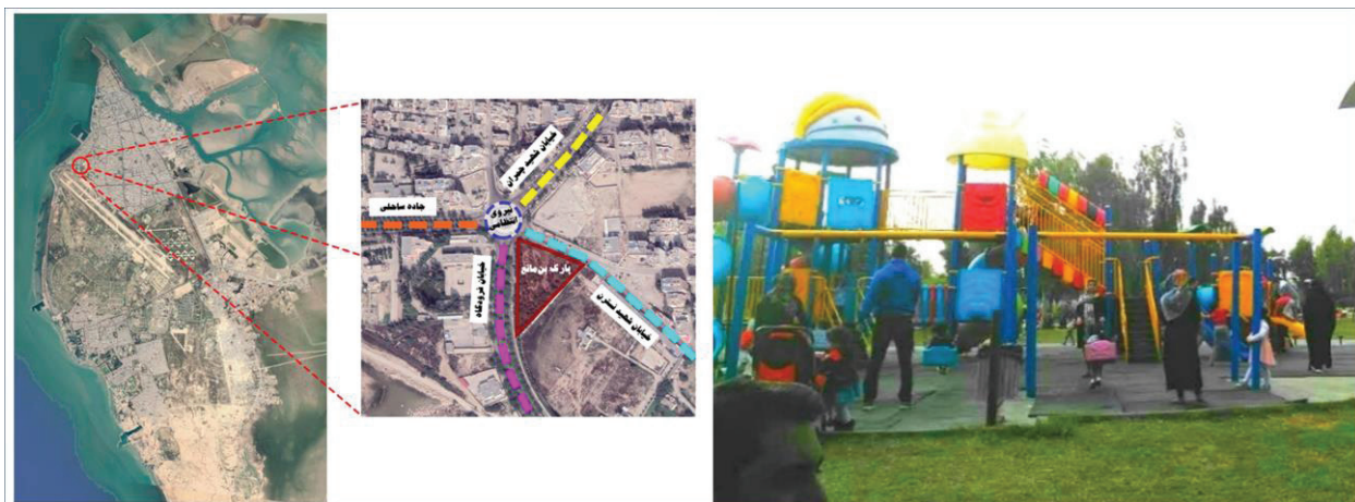
شکل ۲- تصویر و موقعیت پارک بن مانع در شهر بوشهر

پارک بن مانع: این پارک در بخش شمالی شهر بوشهر (منطقه ۱) و در محله بن مانع قرار گرفته است. پارک بن مانع حدود ۱۰۱۵۴ مترمربع مساحت دارد. این پارک به دلیل نزدیکی با سه خیابان شریانی فرودگاه، شهید چمران و ساحلی از اهمیت خاصی برخوردار است (شکل ۲).