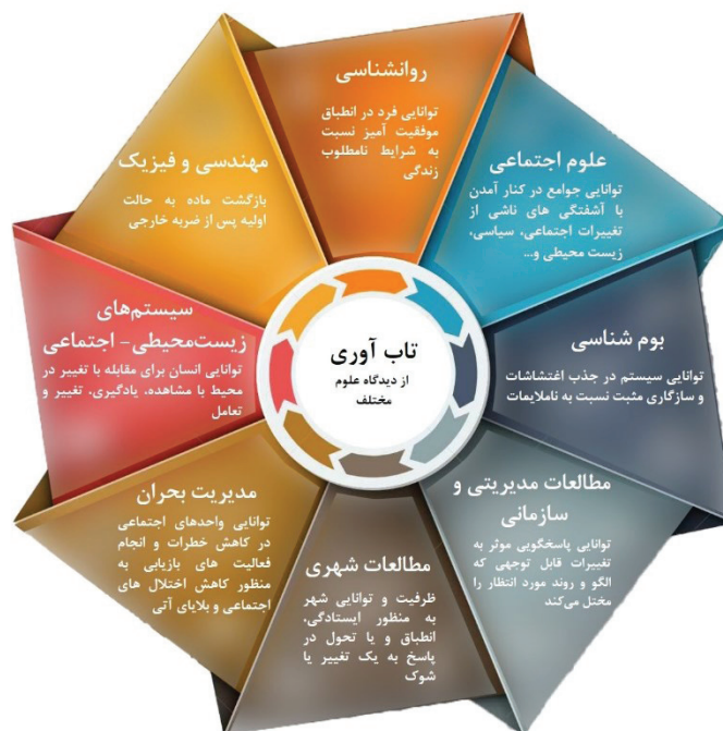
تصویر ۱- مفهوم تاب‌آوری در علوم مختلف (Shamsuddin et al., 2020; Simone et al., 2021)

حسینی، ۱۳۹۷؛ رضایی، ۱۳۹۲؛ حیدری‌فر و همکاران، ۱۳۹۷)