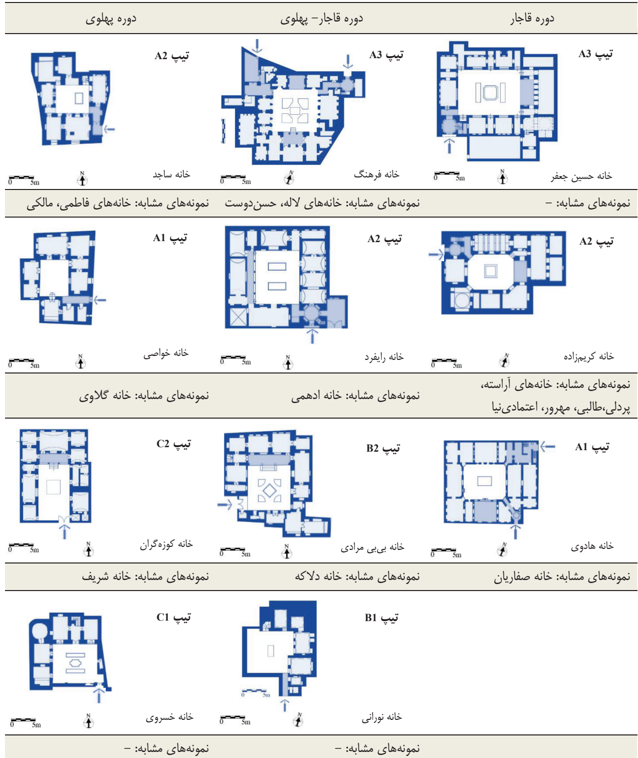
جدول ۱- تیپ‌های سلسله مراتب حرکتی در خانه‌های بیرجند

با تطبیق نمونه‌های جامعه آماری با الگوی سلسله مراتب حرکتی مشخص می‌گردد که از میان ۹ زیرمجموعه الگوهای فوق، ۷ تیپ در خانه‌های بیرجند قابل مشاهده است. جدول ۱ نوع الگوی هریک از نمونه‌ها را به تفکیک دوره تاریخی مشخص می‌کند.