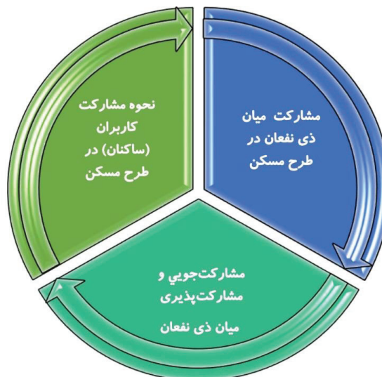
تصویر ۱- حوزه‌های بررسی فرهنگ مشارکتی در مسکن

سه مفهوم اساسی مشارکت اجتماعی عبارتند از: روابط ۲۷ ، اعتماد ۲۸ و مشارکت‌ها ۲۹ (Abbas & Motlak, 2023: 3). این سه مفهوم در رابطه با بخش مسکن اقشار کم‌درآمد و باتوجه به مطالعات مبانی نظری و تبادل نظر با متخصصان، در سه حوزه مشارکت میان ذینفعان، نحوه مشارکت کاربران و مشارکت‌جویی و مشارکت‌پذیری میان ذینفعان، تدوین و براین اساس (تصویر ۱) تنظیم گردید.