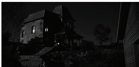
تصویر ۳ - فضای معمارانه خانه و پله (القای هنری هیجان و ترس)