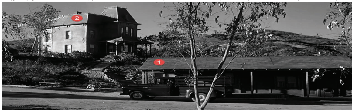
تصویر ۴ - کابین هتل و خانه نورمن دو مکان مشخص در شبکه عینی مکان در جرم (ترکیب مکانی هوشمندانه در فیلم)