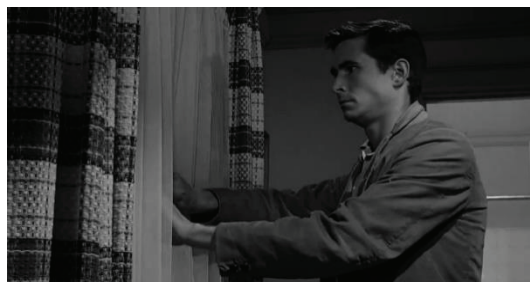
تصویر شماره ۲: نمونه القای فضای ترس به کمک پنجره