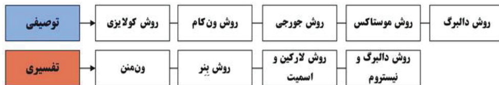
تصویر ۱- دسته‌بندی روش‌های پدیدارشناسی

این بخش باهدف فراهم‌آوردن زمینه‌ای برای شناخت روش‌های متنوع پدیدارشناسی توصیفی و تفسیری که در ادامه مسیر تحقیق پیشرو تبیین خواهد شد، به تشریح مختصری از فلسفه پدیدارشناسی و کلیات روش‌شناختی توصیفی و تفسیری پرداخت. در بخش دوم، بازتاب روش‌های توصیفی و تفسیری از منظر پژوهشگران و محققین حوزه روش‌شناختی پدیدارشناسی گوناگون مورد بررسی و تحلیل قرار می‌گیرند. (تصویر ۱) پاول کالایزی به‌عنوان نخستین متدولوژی از پنج روش پدیدارشناسی توصیفی در ادامه مورد بررسی قرار می‌گیرد.