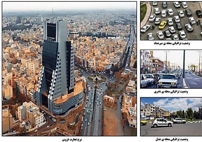
تصویر ۳- برج تجارت قزوین و وضعیت ترافیکی محله‌های آن

موقعیت مطالعه موردی در تقسیم‌بندی‌های (منطقه‌بندی - ناحیه‌بندی - محله‌بندی): در پژوهش حاضر مطالعات بر روی برج تجارت قزوین صورت گرفته که در منطقه ۲ شهرداری قزوین، ناحیه‌ی شهید بابایی و محله‌ی عدل واقع است. این مجتمع از جنوب به بلوار عدل و نادری، از غرب به بلوار میرعماد، از شرق به بلوار دهخدا و از شمال به خیابان فلسطین ختم می‌شود. این برج در نزدیکی بناهای مهم تاریخی از جمله دروازه درب کوشک، خانه سپهدار و عمارت داعی واقع است.