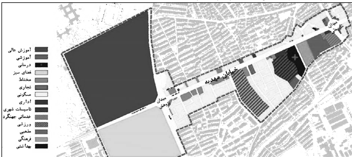
تصویر ۱- نقشه کاربری وضع موجود

نمونه مورد مطالعه خیابانی است که مخاطبین بسیاری آن را به‌عنوان یک خاطره خوب از شهر همدان به یاد دارند. این خیابان به علت قدمت تاریخی و قرار گرفتن در مسیر گردشگری عباس‌آباد از اهمیت قابل‌توجهی برخوردار است. این خیابان منطقه ۴ و ۵ شهرداری را از هم جدا کرده و از کاربری‌های مهم آن می‌توان به مراکز درمانی مهدیه و مسجد مهدیه و بانک ملی مرکزی و قرار گرفتن اداراتی چون برق منطقه‌ای کل استان و باشگاه نخبگان استان و ... اشاره کرد؛ بنابراین با توجه به موضوع تحقیق می‌توان این‌گونه استنباط نمود که گوناگونی فعالیت‌ها و تنوع عملکردی، مطابق تصویر ۱ و به دنبال آن حضور پذیری مردم از یک طرف و از طرف دیگر نزدیکی به پارک بزرگ مردم و قرار گرفتن در مسیر دانشگاه بوعلی و مسیر گردشگری عباس‌آباد و کثرت وجود نشانه‌های صوتی این محدوده می‌تواند منجر به ایجاد بستری مناسب جهت تحقیق، در قالب نمونه موردی شود.