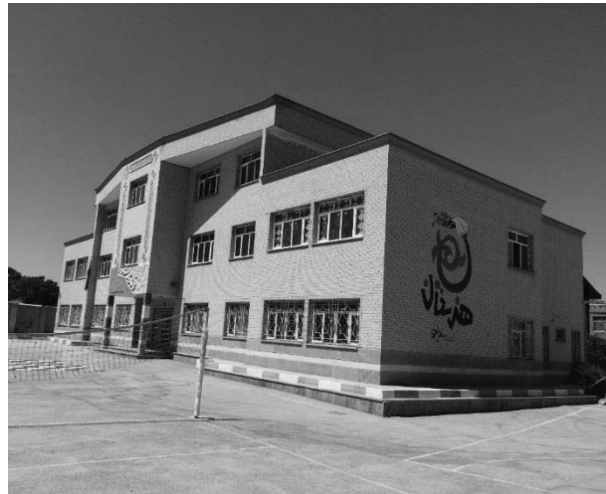
تصویر ۳- هنرستان شهید قدرت‌اله سادجی