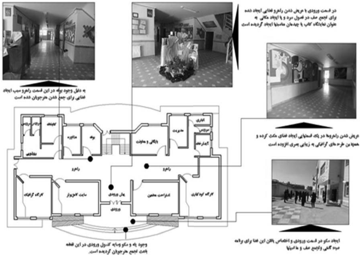
تصویر ۴- نقاط شاخصی که در پلان باعث تعاملات اجتماعی گردیده است مشخص شده است

در کل می‌توان گفت این مکان آموزشی همانند خیلی مدارس، فقط به مورد آموزشی آن پرداخته است، ما عقیده‌مان بر این است که سیستم آموزش و پرورش در دو حیطة آموزش و پرورش گام برمی‌دارد، ولی متأسفانه هیچ‌گونه فضایی که بشود در آن پرورش فکری و شخصیتی دانش‌آموز در نظر گرفته شود یا وجود ندارد یا اگر هم هست به دلیل ناکارآمد بودن آن، می‌توان گفت وجود ندارد. با تحقیق در مکان‌های آموزشی که در مدارس قدیم ایران و مدارس استاندارد که در خارج از کشور ساخته شده‌اند یا تعداد محدودی که در حال حاضر در ایران وجود دارد صورت پذیرفت، به این نتیجه رسیدیم که می‌توان یک دانش‌آموز رو فقط صرفاً در کلاس رشد نداد، می‌توان