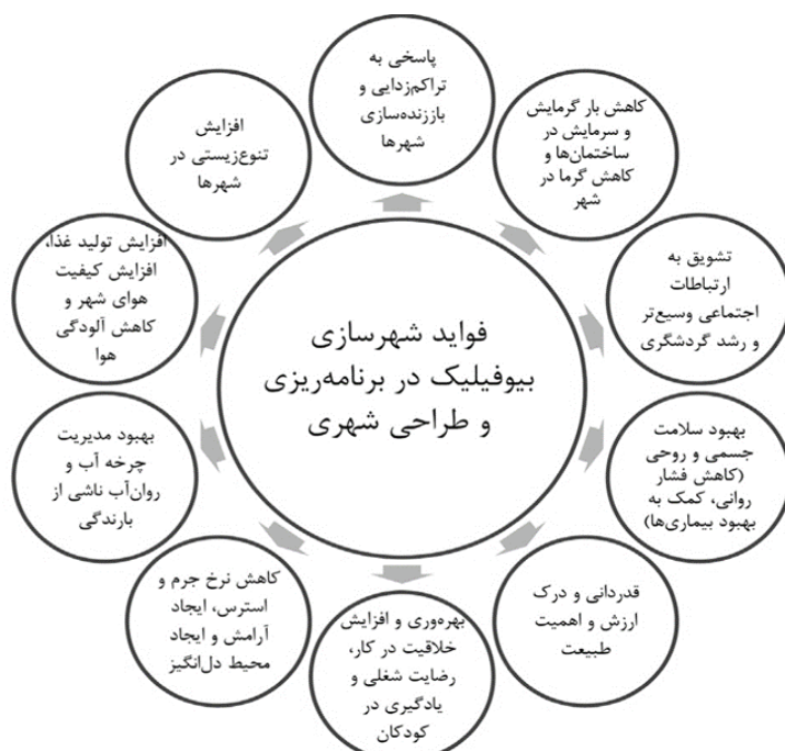
شکل ۱: فواید شهرسازی بیوفیلیک

مفهوم بیوفیلیک به این منظور مدنظر قرار گرفته که انسان ها به ارتباط نزدیکتر با طبیعت و ایجاد شهرهایی که حساسیت بیشتری نسبت به سیستم های طبیعی دارند، خصوصا در ایران، نیازمندند. به این خاطر بهتر است رویکردهایی نظیر بیوفیلیک در طراحی لبه رودخانه هایی که در مجاورت بافت شهری قرار دارند به کار گرفته شوند تا ماهیت طبیعی آنها حفظ شده و یا ارتقا یابد. توجه به مفهوم حساس به آب نیز به جهت ماهیت رودخانه که با عنصر آب در ارتباط تنگاتنگ است و حضور و حیاتش به آب وابسته است ضروری است تا توصیه ها و موارد کاربردی مفهوم طراحی شهری حساس به آب نیز در طراحی و یا ساماندهی رودکناره های شهری بررسی گردیده و مدنظر قرار گیرد.