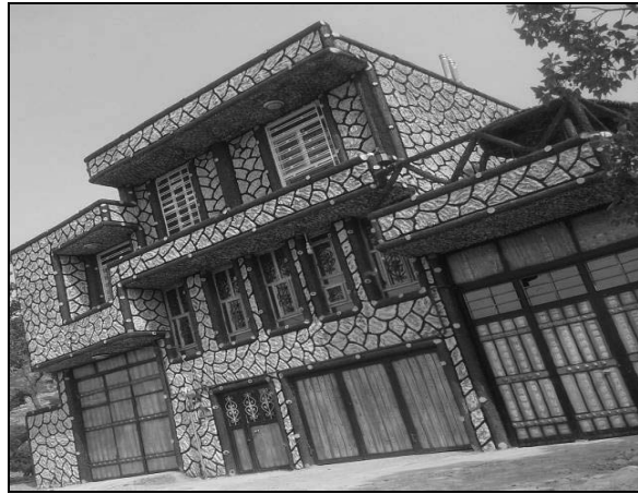
تصویر ۱۳ و ۱۴- مسکن روستایی در چمگل مربوط به دوره ششم با استفاده از مصالح نوین و طرح مدرن (۹۱-۱۳۸۰)