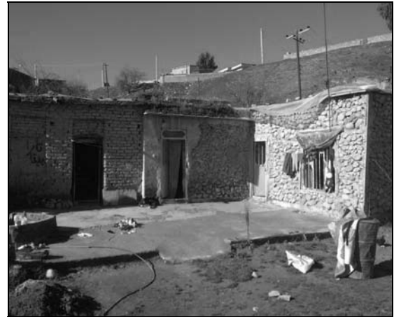
تصویر ۵ و ۶ - مسکن روستایی چمگل در دوره سوم با طراحی حیاط مرکزی و طرح دو طبقه (۵۷-۱۳۴۲)