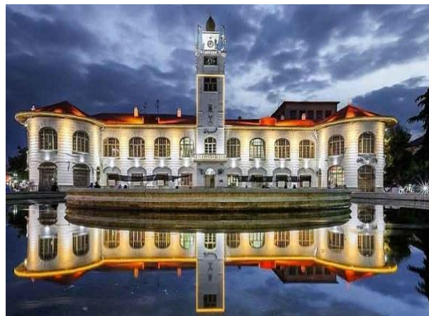
تصاویر ۳ و ۴- محدوده پیاده راه فرهنگی شهرداری رشت

از دیگر دلایل انتخاب این محدوده می‌توان به پتانسیل فعالیت‌پذیری و شکل‌گیری تعامل میان مردم و سطح بالای فعالیت اقتصادی در این محدوده اشاره نمود. این محدوده از شمال با بخشی از خیابان سعدی، از جنوب با بخشی از خیابان امام خمینی، و از غرب با کل خیابان علم‌الهدی ادغام شده است. میدان شهرداری رشت علاوه بر داشتن مرکزیت و محوریت اصلی، به دلیل برخورداری از بازار قدیمی و تاریخی