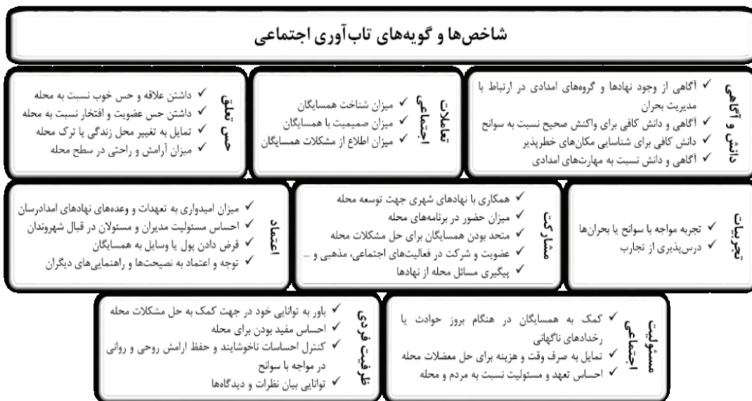
تصویر ۲- شاخص‌ها و گویه‌های موثر بر تاب‌آوری اجتماعی

در نهایت پس از انتخاب شاخص‌ها در راستای دستیابی به اهداف پژوهش و ارزیابی میزان تاب‌آوری اجتماعی، گویه‌هایی به منظور سنجش هر شاخص تدوین شده است. در نهایت پس از بررسی میزان تاب‌آوری اجتماعی با توجه به شاخص‌های تدوین شده و همچنین به تفکیک ویژگی‌های جمعیتی-اجتماعی، با کمک نرم‌افزار SPSS و استفاده از تحلیل رگرسیون خطی، ارتباط میان ویژگی‌های جمعیتی-اجتماعی و تاثیر آن بر تاب‌آوری اجتماعی مورد بررسی قرار گرفته است. همچنین نظرات ساکنان در مورد سنجه‌ها و سوالات مطرح شده در قالب طیف پنج گزینه‌ای لیکرت (از خیلی زیاد تا خیلی کم) مشخص شده است. در نمودار شماره ۲ شاخص‌ها و سنجه‌های موثر بر تاب‌آوری اجتماعی ساکنان که مبنای بررسی این پژوهش قرار گرفته، نشان داده شده است.