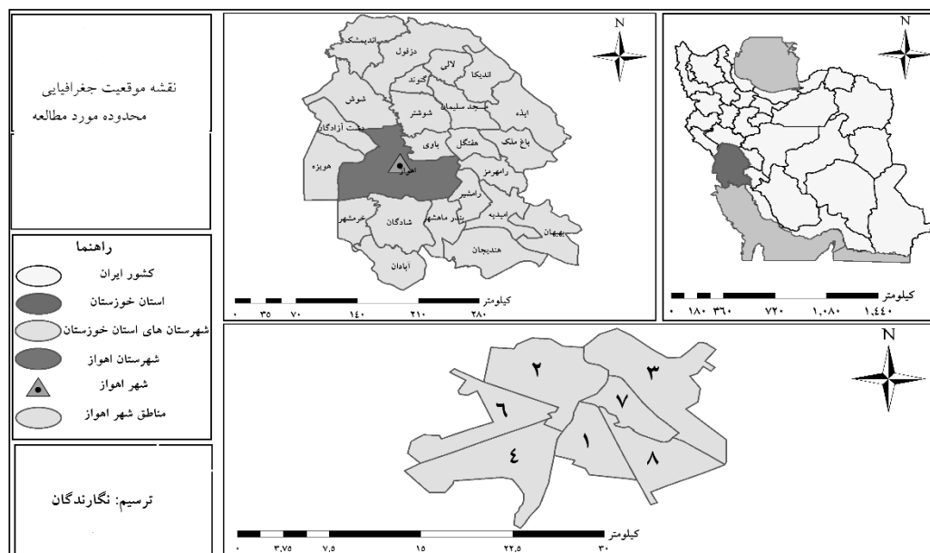
شکل ۲. موقعیت جغرافیایی شهر اهواز در شهرستان، استان، کشور پردازش: نگارندگان، ۱۳۹۴.

شهر اهواز به‌عنوان یکی از شهرهای بزرگ ایران و مرکز شهرستان اهواز و استان خوزستان از نظر جغرافیایی در ۳۱ درجه و ۲۰ دقیقه عرض شمالی و ۴۸ درجه و ۴۰ دقیقه‌ی طول شرقی قرار گرفته است. این شهر با مساحت ۲۲۰ کیلومترمربع دومین شهر وسیع ایران پس از تهران می‌باشد.