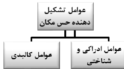
تصویر ۲: عوامل شکل دهنده حس مکان

با توجه به مفهوم حس مکان در دیدگاه های مختلف و سطوح مختلف آن، عوامل شکل دهنده حس مکان را می توان به دو گروه تقسیم کرد: