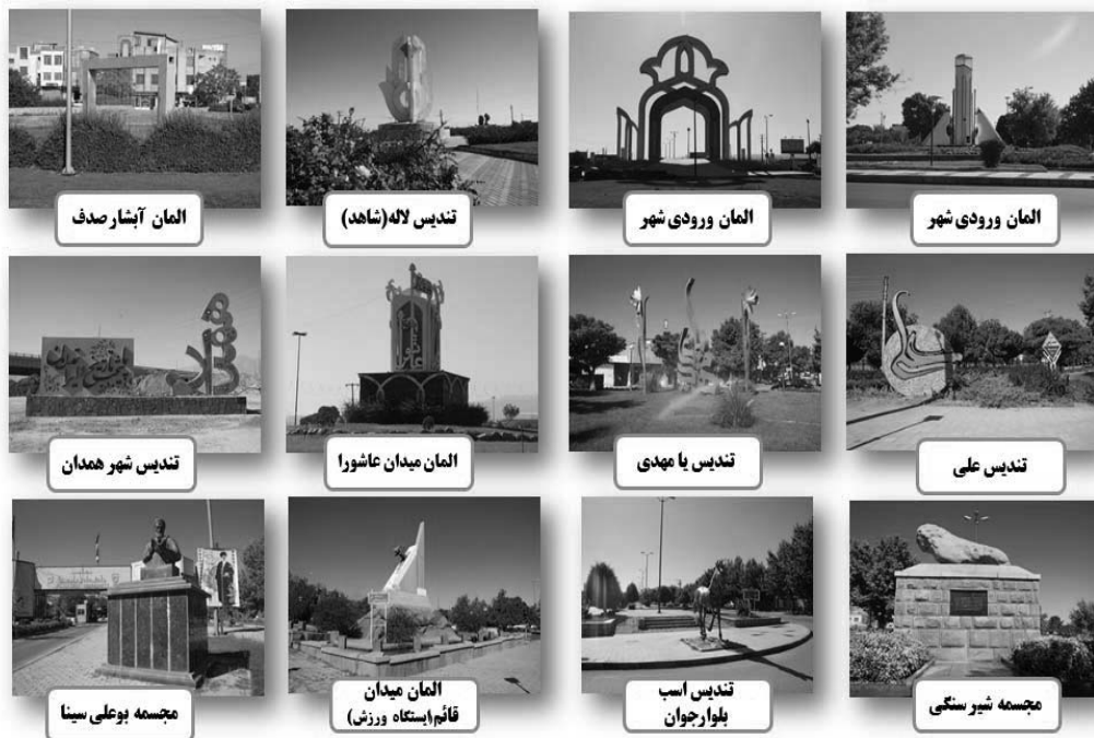
تصویر ۴: نمونه ای از المان های شهر همدان

استقبال بی نظیر شهروندان همدانی از المان های موجود، نشانه مناسبی برای درک میزان موفقیت این فضاها در جلب نظر شهروندان می باشد به نحوی که این فضاها به عنوان رقیبی سرسخت در کنار سایر فضاهای فراغتی شهر به نحو قابل توجهی خودنمایی می کند. تعبیه کاربری های خدماتی مناسب و طراحی متنوع فضاها و کیفیت خوب طراحی و هماهنگی آن با شرایط اجتماعی استفاده کنندگان را می توان از عوامل موفقیت برخی از المان های موجود در شهر همدان دانست.