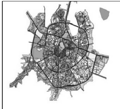
تصویر ۳: موقعیت استان و شهر همدان

همانطور که پیشتر گفته شد المان های شهری از اجزای مهم مبلمان شهری است که در ارتقای حس مکان و هویت شهروندان تأثیر بسزایی دارد. از انواع المان های موجود در شهر همدان می توان به المان هایی نظیر المان میدان امام خمینی (ره)، آرامگاه بوعلی سینا، آرامگاه باباطاهر، المان آبشار صدف، تندیس لاله (میدان شاهد)، المان ورودی های شهر (میدان امام حسین و میدان بسیج)، المان عاشورا (میدان عاشورا)، تندیس یامهدی (فلکه پاسداران) و علی (ورودی شهرک مدرس)، مجسمه بوعلی سینا (ورودی دانشگاه بوعلی سینا)، المان ورزش صبحگاهی (میدان قائم)، المان اسب (بلوار جوان)، مجسمه شیرسنگی (میدان شیرسنگی) و غیره اشاره کرد که برخی از آنها جنبه نمایشی، هنری و زیبایی دارند (نظیر المان اسب) و برخی نیز جنبه مفهومی، بیانی (نظیر المان آرامگاه باباطاهر و بوعلی سینا و ...) و به عبارتی القا کنندهی واقعه ای خاص در مکان مورد نظر یا بیان ویژگی های خاص منطقه مذکور به بیننده می باشد.