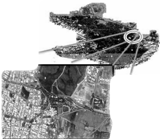
تصویر ۱، عکس هوایی محدوده

محدوده میدان سپاه در قسمت شمال شرقی ملایر قرار دارد. این محدوده یکی از مراکز تفریحی شهر ملایر را در بر گرفته است و بسیاری از سفرها و جابه‌جایی جمعیت به این محدوده به‌منظور انجام فعالیت‌های تفریحی صورت می‌گیرد. همچنین این میدان یکی از راه‌های اصلی برای رسیدن به بیمارستان امام حسین و دانشگاه آزاد اسلامی و دانشکده عمران و معماری نیز می‌باشد؛ بنابراین، ضرورت جابه‌جایی جمعیت در این محدوده بالاست. در محدوده مورد مطالعه بیشترین کاربری به کاربری فضای سبز و در رتبه دوم کاربری تجاری قرار دارد. از جمله کاربری‌های شاخص در اطراف محور مورد مطالعه، پارک سیفیه و بام ملایر است.