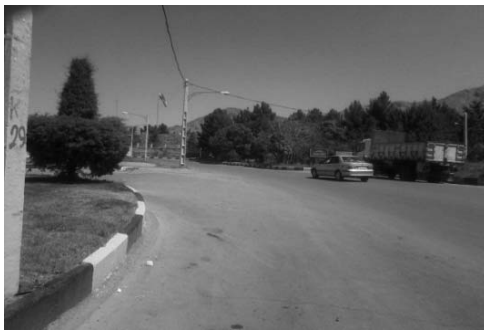
تصویر ۴- مسیر انتخابی برای ایجاد پیاده راه