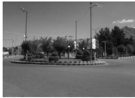
تصویر ۳- میدان سپاه

با توجه به ماهیت مطالعه و فرضیه مطرح شده، روش تحقیق، توصیفی- تحلیلی است. روش جمع‌آوری اطلاعات نیز به صورت مطالعات اسنادی و میدانی است. با استفاده از کلیه اطلاعات مستند و قابل دسترس به صورت مطالعه میدانی و بررسی آماری، پرسش‌نامه‌ای تهیه و از ۳۰ نفر از گروه‌ها و طبقات مختلف اجتماعی به صورت نمونه تصادفی در محیط پیرامون میدان سپاه توزیع و مصاحبه به عمل آمد. در نهایت ۲۶ پرسشنامه که واجد ارزش‌های کامل اطلاعاتی بود، انتخاب گردید و داده‌ها مورد تحلیل قرار گرفت و طبق تحلیل پرسشنامه‌ها نتایج زیر حاصل شد: