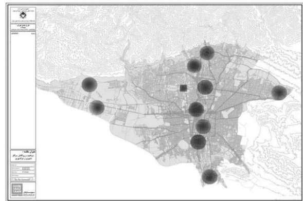
تصویر ۳- نقشه موقعیت مرکز فعالیت‌های نوین تهران در تهران

محدوده‌ی شمال ناحیه ۱ منطقه ۱۱ و محدوده‌ی شمال غربی ناحیه ۱ منطقه ۱۲ تشکیل دهنده‌ی بخش‌های این مرکز هستند. مرکز فعالیت‌های نوین تهران از شمال ضلع غربی هفت تیر و محورهای افقی کریم‌خان زند، بلوار کشاورز و فاطمی، از شرق محورهای مفتح، شریعتی و سعدی، از جنوب محور جمهوری و از غرب محورهای کارگر، دکتر قریب و جمال‌زاده جنوبی محدود شده‌است. مرکز فعالیت‌های نوین تهران به‌عنوان مرکز شهر، مجموعه‌ای از کاربری‌های اداری، تجاری، بهداشتی-درمانی، خدماتی، آموزشی و تفریحی را دارا می‌باشد. عملکرد غالب بر این محدوده نقش آموزشی و دانشگاهی آن است که تحت تأثیر محور انقلاب و دانشگاه‌های موجود در این محدوده بیشتر از هر فعالیت دیگر مشهود است. شبکه دسترسی این محدوده جزء قدیمی‌ترین و اولین مسیرهایی است که در تهران از سال ۱۳۳۰ در دوران آغاز مدرنیته در ایران احداث شد و با توجه به رشد شتابان شهری در حال حاضر بافت شطرنجی نامنظم دارد. به دلیل تراکم جمعیت، ترافیک سنگین و آلودگی هوا در روز تا هنگام تعطیلی ادارات، مراکز آموزشی، مغازه‌ها و... این محدوده در طرح ترافیک قرار دارد.