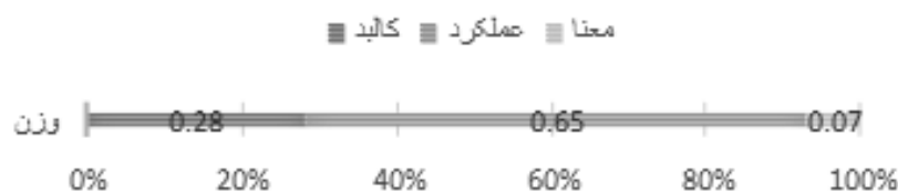
تصویر ۵- نمودار اولویت‌بندی معیارهای اصلی

با توجه به نمودار مفهومی ۲، معیارهای مورد نظر با گزینه‌ها در رابطه بوده و گزینه‌ها با روش سلسله‌مراتبی وزن‌دهی شدند. بین اهداف و این سه اصل سازنده پیوند ایجاد شده‌است. نیازهای مردم در تمام معیارها، توجه ایجاد تفاوت در زمان‌های تعطیل و ایام هفته ضمن هماهنگی و ایجاد زندگی شبانه در تمام لحظات و استفاده مناسب از موقعیت محدوده در جهت ایجاد خلاقیت با استفاده از ایجاد ارتباط با معیارها و زیرمعیارهای مطرح‌شده مؤثر خواهد بود. با توجه به وزن‌دهی معیارهای اصلی، مردم بیشترین تأثیر را بر مؤلفه‌های فضای شهری دارند و به ترتیب خلاقیت و زمان عوامل بعدی مؤثر بر فضاهای شهری است.