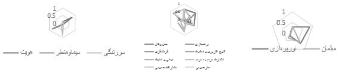
تصویر ۶- نمودار تعیین میزان اهمیت معیارها و زیرمعیارها

در بخش وزن‌دهی گزینه‌ها، به ترتیب مردم، خلاقیت و زمان بر مؤلفه‌های فضای شهری مؤثر بوده است. که هر یک از گزینه‌ها بر اساس معیار موجود در محدوده مرکز فعالیت‌های نوین تهران بررسی شده است که در جدول زیر به شکل کامل نشان داده شده است.