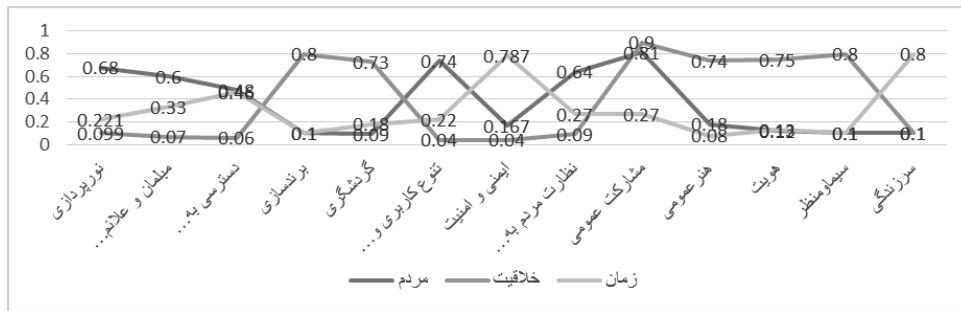
تصویر ۷- نمودار تعیین میزان اهمیت گزینه‌ها