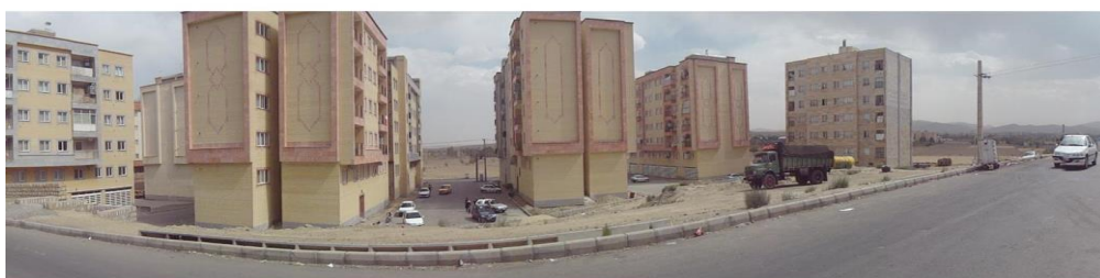
تصویر ۳- نمای کلی از سایت