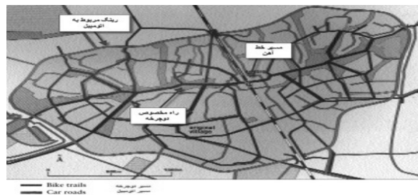
تصویر ۱: طرح شهر هوتن (Houten) در هلند (طرح پروانه ای) ماخذ: Beatley :2000"50

شهرهای اقماری، به شکل جوامعی در ارتباط با نواحی مادرشهری که پیوند و عملکرد مستحکم و اساسی با شهر مرکزی برقرار می‌کنند طراحی شده‌اند. مواصلات و ارتباطات مناسب (با مادرشهر) امری ضروری است و زمان جابه‌جایی و مسافرت روزمره به مرکز شهر نباید از ۳۰ تا ۴۰ دقیقه فزونی یابد (Lum and Hu, 2004). با توجه به مطلب ذکر شده، در زمینه حمل نقل شهرهای جدید آنچه حائز اهمیت است سرعت و فاصله زمانی طی شده تا مادر شهر است که نوع وسیله نقلیه در این زمینه تعیین‌کننده است. تجربه اکثر شهرهای جدید در سراسر دنیا متکی بر حمل و نقل ریلی است. نمونه بارز این تجربه در مورد شهرهای بریتانیاست. یا به عنوان نمونه‌ای دیگر یکی از دلایل موفقیت پنج شهر جدید ساخته شده در اطراف شهر سئول، ارتباط آنها به مرکز شهر بوسیله مترو است (معصوم، ۱۳۸۰). علاوه بر توجه به ارتباط مناسب میان شهر جدید و مادرشهر نباید نسبت به سلسله مراتب دسترسی در سطح شهر جدید و محلات بی‌توجه بود، شهر جدید هوتن ۵ در هلند در فرم فشرده پروانه‌ای شکل (شکل شماره ۱) طراحی شده که دو نوع قابلیت حرکت در تصویر نشان داده شده است. جابه‌جایی با اتومبیل منوط به مسیر خارجی و رینگ است (که شهر را محصور کرده است). بیشتر مسیر حرکت در شهر بر مبنای حرکت پیاده و دوچرخه انجام شده است (Beatley, 2000).