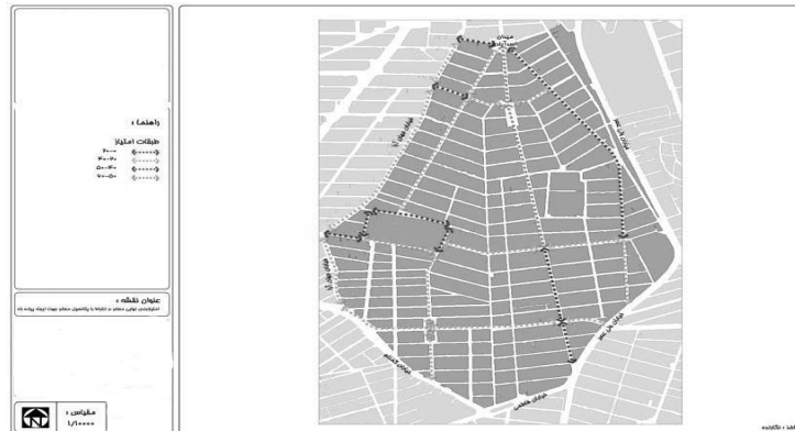
شکل ۵ - امتیازبندی نهایی معابر در ارتباط با پتانسیل معابر جهت ایجاد پیاده‌راه

ب- تبیین فرایند کلی ارزیابی و پتانسیل‌سنجی معابر جهت حرکت پیاده: به منظور تعمیم نتایج حاصل از پژوهش به سایر موارد مشابه و استفاده از فرایند پژوهش در سایر پروژه‌ها به منظور ارزیابی و سنجش پتانسیل موجود معابر برای یافتن مسیرهای مطلوب جهت تردد پیاده، با استفاده از روش جمع وزنی (حاصل ضرب وزن نسبی معیارها و زیرمعیارها در ساختار سلسله مراتبی) ارزش لایه‌های اطلاعاتی در GIS مشخص می‌شود. و در نهایت امتیاز نهایی معابر از جمع‌بندی ارزش‌های وزنی با استفاده از عملیات جبری نقشه‌ها در محیط GIS محاسبه می‌شود. از جمع‌بندی ارزش‌های وزنی به دست آمده برای هر یک معابر در ارتباط با معیارهای کاربری زمین، ایمنی ترافیکی امتیاز نهایی هر یک از معابر مورد نظر در ارتباط با پتانسیل معابر جهت ایجاد مسیرهای مناسب تردد پیاده به دست می‌آید. باید گفت اعداد بزرگ‌تر نشان از پتانسیل بیشتر معابر جهت حرکت پیاده می‌باشد.