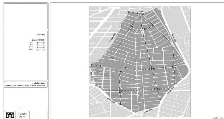
شکل ۴ - امتیازبندی معابر در ارتباط با معیار ایمنی ترافیکی

از جمع بندی ارزش‌های وزنی به دست آمده برای هر یک از معابر در ارتباط با شاخص‌های جدایی پیاده‌رو از سطح سواره‌رو، تراکم ترافیک، عرض مفید پیاده‌رو و عرض عبور پیاده‌ها امتیاز نهایی هر یک از معابر محدوده مورد مطالعه در ارتباط با معیار ایمنی ترافیکی به دست می‌آید. شکل ۴، امتیازبندی معابر در ارتباط با معیار ایمنی ترافیکی را نشان می‌دهد. خیابان شریانی درجه ۲ فتحتی شقاقی با توجه به عدم جدایی مناسب پیاده‌رو از