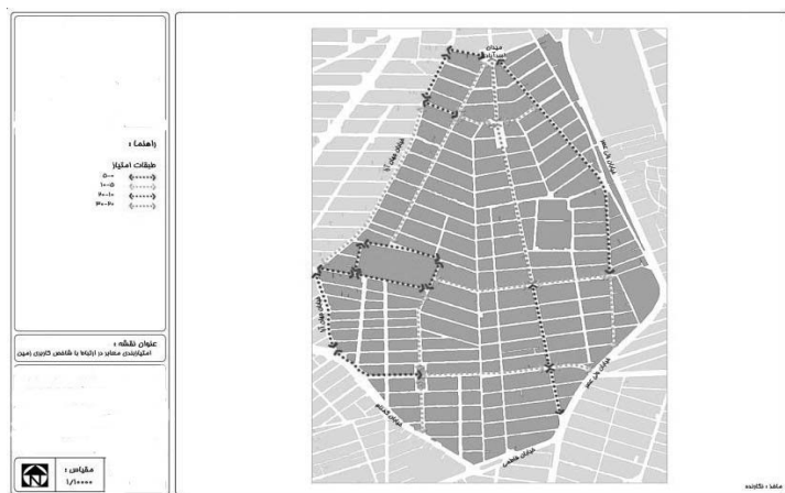
شکل ۳ - امتیازبندی معابر در ارتباط با معیار کاربری زمین

ب-۱- پتانسیل‌سنجی معابر محدوده مورد مطالعه جهت حرکت پیاده در ارتباط با معیار کاربری زمین: از جمع‌بندی