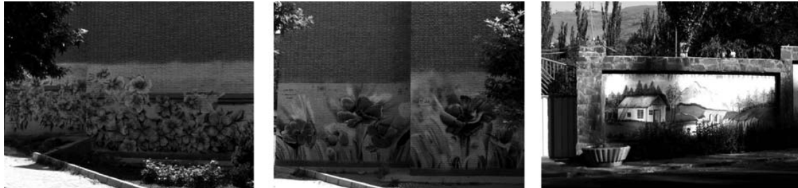
شکل ۳: نقاشی دیواری نرسیده به گنجامه همدان. شکل ۴ و ۵: نقاشی‌های دیواری بر دیوار خانه‌های مجاور بلوار شهید کاشانی همدان.

توجه به ویژگی‌های محیطه استقرار اثر در مکان (بررسی جنس مخاطب از نظر کیفیتی و فرهنگی): به جز توجه به جغرافیای فرهنگی و اقلیمی یک شهر، می‌توان برنامه‌ای برای محله‌های شهری تعیین نمود. به طور مثال همان قدر جابه‌جایی میدان تجریش با میدان آزادی که - معرف ورودی یک شهر است- کار اشتباهی است که جابه‌جایی میدان امام خمینی (ره) با میدان بعثت در همدان اشتباه به نظر می‌رسد. اگر به بافت فرهنگی مردمی که از این دو میدان تردد می‌کنند توجه شود می‌توان از جایگیری صحیح این دو میدان به شکلی مناسب خبر داد. در نتیجه می‌توان با توجه به کارکرد و ابنیه‌های تاریخی، شهر را به لحاظ گرافیک محیطی سیاست‌گذاری کرد. این سیاست‌گذاری می‌تواند نسبت به تابلوهای بزرگ تبلیغاتی - بیلوردها - نیز برقرار باشد. به طور مثال آثاری از جنس گردشگری در میدان آرامگاه بوعلی سینا و آثاری مذهبی در اطراف مکان‌هایی همچون میدان امامزاده عبدا... استقرار یابند. استفاده از این امر همچنین می‌تواند در کنترل نسبی مخاطبان و جذب حداکثری آن‌ها میسر باشد؛ در غیر این صورت مخاطب با آشفتگی بصری و همچنین مفهومی مواجه می‌شود. در شکل ۶ اثری فوویستی در کنار تبلیغاتی از مراسم مذهبی نمونه بارز بی‌ارتباطی میان این دو پیام برای شهروندان را نشان می‌دهد.