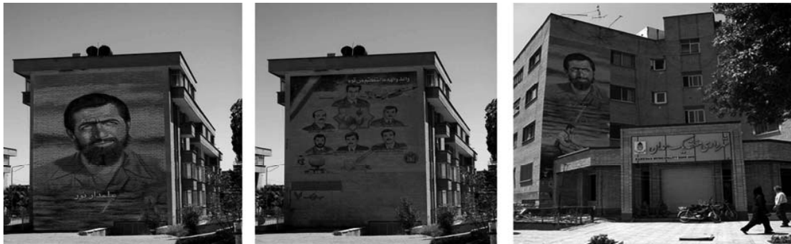
شکل ۱۵: نقاشی دیواری میدان امام زاده عبدا... شکل ۱۶: نقاشی دیواری بلوار شهید کاشانی شکل ۱۷: تلفیق نقاشی از تصویر ۱۵

انتخاب دیوار یک امر کارشناسانه است؛ و انتخاب اثری شایسته و ارزنده بر دیوارهای منتخب نیز کاری است که از کارشناسان هنری باید انتظار داشت. هر دیوار وسیع و خالی از تصویر که در محل تردد شهروندان قرار گرفته نمی‌تواند فضای مناسبی برای اجرای نقاشی‌های دیواری باشد. با جابه‌جایی یک تصویر نقاشی و انتقال آن به دیواری دیگر می‌توان شرایط هر دو دیوار را به لحاظ بصری مناسب کرد، و با حفظ ارزش‌های دفاع مقدس، می‌توان آلودگی‌های بصری و تصمیم‌گیری‌های غیر کارشناسانه را تعدیل نمود. به طور مثال اگر یک نقاشی از شکل ۱۵ بر دیوار شکل ۱۶ منعکس شود و در نتیجه شکل ۱۷ حاصل شود، با توجه به زاویه خیابان خواجه رشید نمای ساختمان و تصویر چهره شهید مختل نمی‌شود. اما اگر به این دو اثر توجه شود می‌توان دریافت که در شکل ۱۵ نقاشی چهره شهید با پنجره‌ها شرایط نامطلوبی را ایجاد کرده که بجز دیده نشدن چهره شهید، نمای ساختمان نیز از منظر تصویری آشفته شده است. به همین طریق اگر به شکل ۱۶ نیز رجوع شود می‌توان دریافت که آشفته‌گی تصویر، نیمه‌کاره رها شدن، کثیف شدن دیوار و اضافه شدن - نوشته بلوک ۷ - بر مضامین نقاشی باعث شده که مخاطب با یک اثر چکنویس و نه پاک‌نویس مواجه شود. تعداد کثیر این آثار در این خیابان فوریت بازنگری را برای تصمیمات مسئولین مضاعف می‌سازد (اردلانی، ۱۳۹۲).