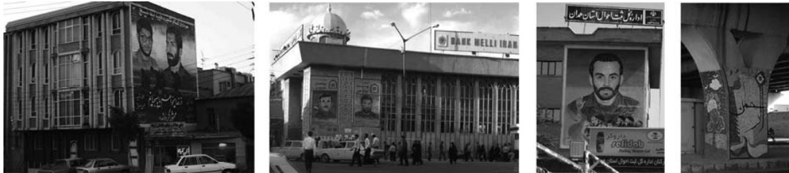
اشکال ۱۱-۱۴: نقاشی‌های دیواری در مکان‌های مختلف شهر همدان

انتخاب دیوار یک امر کارشناسانه است؛ و انتخاب اثری شایسته و ارزنده بر دیوارهای منتخب نیز کاری است که از کارشناسان هنری باید انتظار داشت. هر دیوار وسیع و خالی از تصویر که در محل تردد شهروندان قرار گرفته نمی‌تواند فضای مناسبی برای اجرای نقاشی‌های دیواری باشد. با جابه‌جایی یک تصویر نقاشی و انتقال آن به دیواری دیگر می‌توان شرایط هر دو دیوار را به لحاظ بصری مناسب کرد، و با حفظ ارزش‌های دفاع مقدس، می‌توان آلودگی‌های بصری و تصمیم‌گیری‌های غیر کارشناسانه را تعدیل نمود. به طور مثال اگر یک نقاشی از شکل ۱۵ بر دیوار شکل ۱۶ منعکس شود و در نتیجه شکل ۱۷ حاصل شود، با توجه به زاویه خیابان خواجه رشید نمای ساختمان و تصویر چهره شهید مختل نمی‌شود. اما اگر به این دو اثر توجه شود می‌توان دریافت که در شکل ۱۵ نقاشی چهره شهید با پنجره‌ها شرایط نامطلوبی را ایجاد کرده که بجز دیده نشدن چهره شهید، نمای ساختمان نیز از منظر تصویری آشفته شده است. به همین طریق اگر به شکل ۱۶ نیز رجوع شود می‌توان دریافت که آشفته‌گی تصویر، نیمه‌کاره رها شدن، کثیف شدن دیوار و اضافه شدن - نوشته بلوک ۷ - بر مضامین نقاشی باعث شده که مخاطب با یک اثر چکنویس و نه پاک‌نویس مواجه شود. تعداد کثیر این آثار در این خیابان فوریت بازنگری را برای تصمیمات مسئولین مضاعف می‌سازد (اردلانی، ۱۳۹۲).