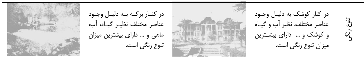
جدول ۳: نتایج تحلیل و بررسی بعد احساسی دیدگاه‌های بازدیدکنندگان از دو فضای باغ ارم (نگارندگان)