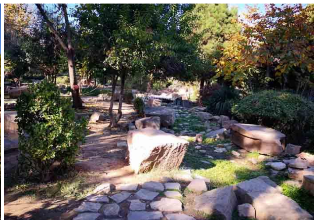
تصویر ۳: محدوده "۲" هندسه نامنظم باغ ارم (نگارندگان)