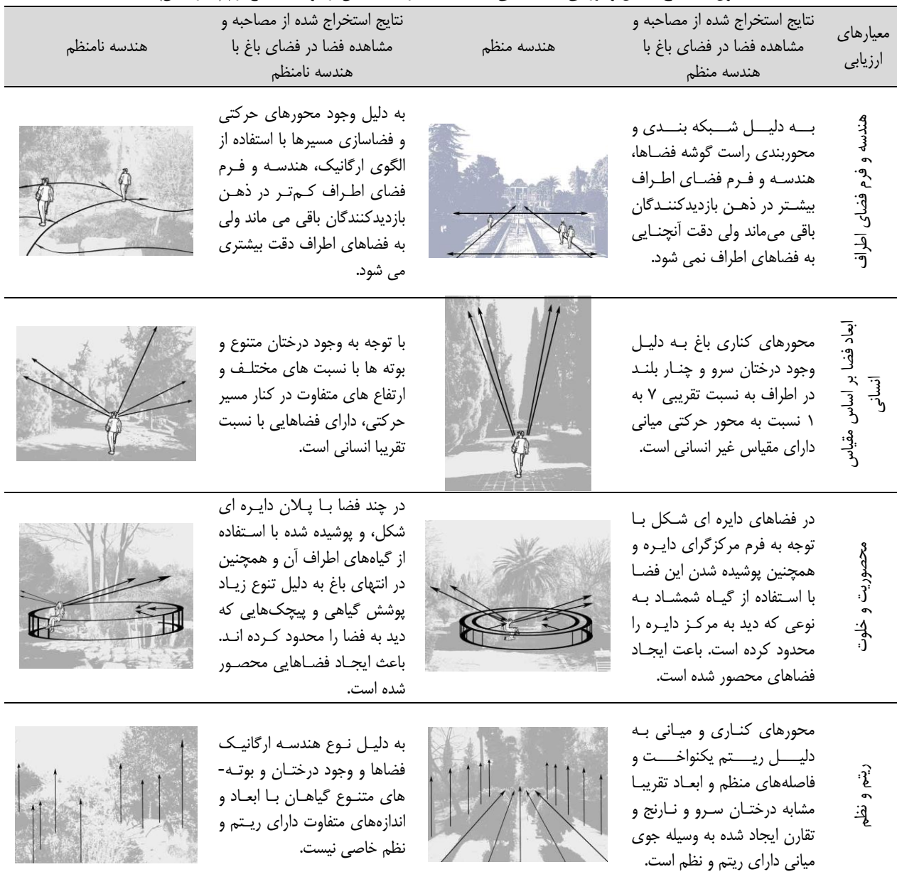
جدول ۲: نتایج تحلیل و بررسی بعد شناختی دیدگاه‌های بازدیدکنندگان از دو فضای باغ ارم (نگارندگان)

مبنای تحلیل در این پژوهش همان طور که در صفحات قبل ارائه شد، بر اساس ۴ بعد ادراکی و معیارهای تحلیل بر اساس دیدگاه‌های نظریه پردازانی مانند: سیته، کالن، اسمیت و... انتخاب شده است. به عبارتی بهتر متغیر مستقل، ادراک و متغیر وابسته معیارهای تحلیل ابعاد شناختی، احساسی، تفسیری ادراک و... می‌باشد. در همین راستا بر اساس فرمول کوکرین با ضریب خطای ۵ درصد تعداد ۳۸۳ عدد پرسشنامه بین گردشگرانی که از هر دو فضای مورد نظر در باغ بازدید کرده بودند، پخش گردید. جامعه آماری انتخاب شده در این پژوهش جامعه ای همگن، (افراد بین ۱۸ تا ۴۵ سال) است. و با توجه به ابعاد شناختی، احساسی، تفسیری و ارزش گذاری سوالات مد نظر مورد مصاحبه و پرسش قرار گرفته است. در ادامه پژوهش چکیده‌هایی از نتایج به دست آمده از پرسش‌نامه و مصاحبه با بازدیدکنندگان از هر دو فضای باغ ارم در قالب چهار بعد ادراک، در جداول زیر ارائه شده است.