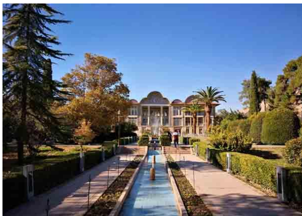
تصویر ۴: محدوده "۱" هندسه منظم باغ ارم (نگارندگان)