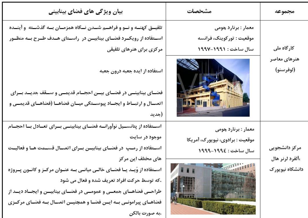
جدول ۳- تحلیل و بررسی معیارها و شکل گیری فضای بینابین در مصادیق خارجی انتخاب شده