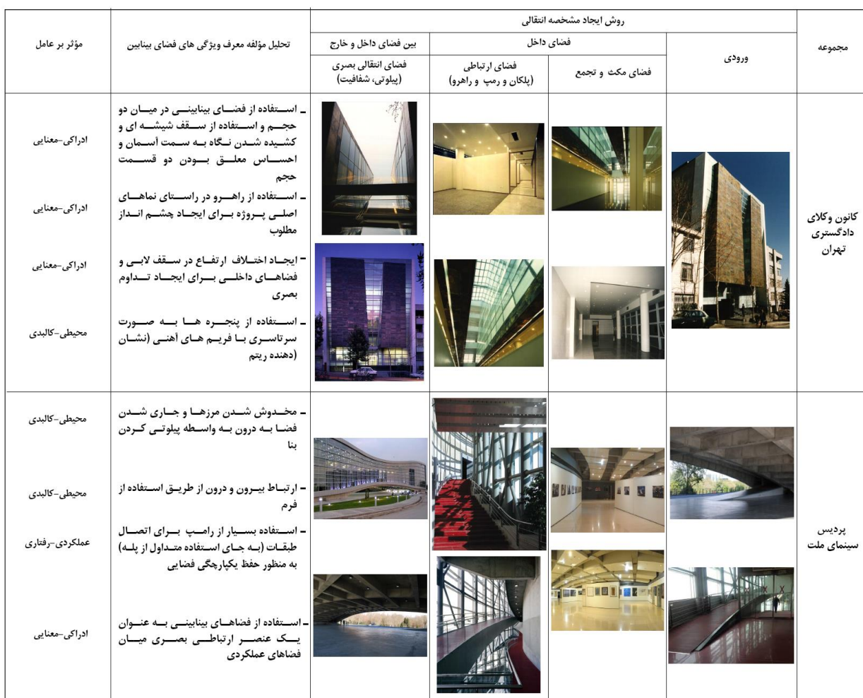
جدول ۴- تحلیل و بررسی معیارها و شکل گیری فضای بینابین در مصادیق داخلی انتخاب شده

حال با توجه به ماهیت هنرمآبانه معماری باید در نظر داشت که در این بخش ممکن است پروژه ای به طور همزمان در برادرنده ویژگی های مختلفی از فضای مابین باشند. در همین راستا عوامل فضای مابین در قالب سه دسته در نظر گرفته شده اند: کالبدی، عملکردی، معنایی و روش ایجاد مشخصه انتقالی در چهار دسته طبقه بندی شده اند. علاوه بر آن، به منظور شفاف کردن هرچه بیشتر نتایج حاصل از این نوشتار با استفاده از یک بررسی تطبیقی، میزان کیفی استفاده از فضای مابین در نمونه های معماری مبتنی بر این مبانی مورد بررسی قرار می گیرد. در واقع تحلیل عامل کالبدی و عملکردی موضوعی کاملاً عینی محسوب می شوند و به طور کامل برای ایجاد ارتباط، فضای بینابین طراحی می شود و با بهره گیری از عناصر و اجزاء معماری نمود پیدا می کند ولی عامل معنایی (ادراکی) جزء دریافت های ذهنی انسان از محیط اطراف دسته بندی می شوند و تنها با ایجاد شفافیت و دید بدون مانع برای فرد و یا با در نظر گرفتن فعالیت های مشابه موجب می شود فرد هر دو فضا را در امتداد هم و احساسی از بینابینی و پیوستگی در فرد ایجاد کند.