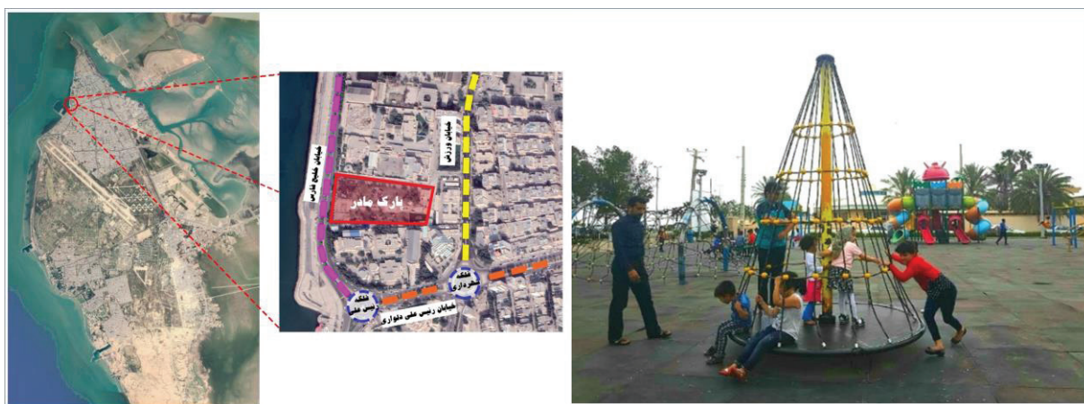
شکل ۱- تصویر و موقعیت پارک مادر در شهر بوشهر

شهر بوشهر در جنوب غربی ایران و به صورت شبه جزیره و از سه جهت به دریا منتهی می شود و تنها از قسمت شرقی آن از طریق محور بوشهر- شیراز با خشکی ارتباط دارد. شهر بوشهر بر اساس سرشماری سال ۱۳۹۵ با جمعیت ۲۲۳۵۰۴ نفر، بزرگ ترین شهر استان بوشهر است (زیاری و همکاران، ۱۳۹۷: ۷). با توجه به هدف پژوهش، در ادامه چهار پارک شهری بوشهر که مراجعه کنندگان زیادی از رده سنی کودکان دارند، به عنوان نمونه های موردی این پژوهش انتخاب شده است که معرفی مختصری از آنها در ادامه آمده است: پارک مادر: این پارک در بخش شمالی شهر بوشهر (منطقه ۱) و در محله کوی بندر قرار گرفته است. این پارک در کنار خیابان شریانی خلیج فارس واقع شده است و فاصله نزدیکی با لبه ساحلی شهر دارد. این پارک در حدود ۱۴۰۰۶ مترمربع مساحت دارد (شکل ۱).