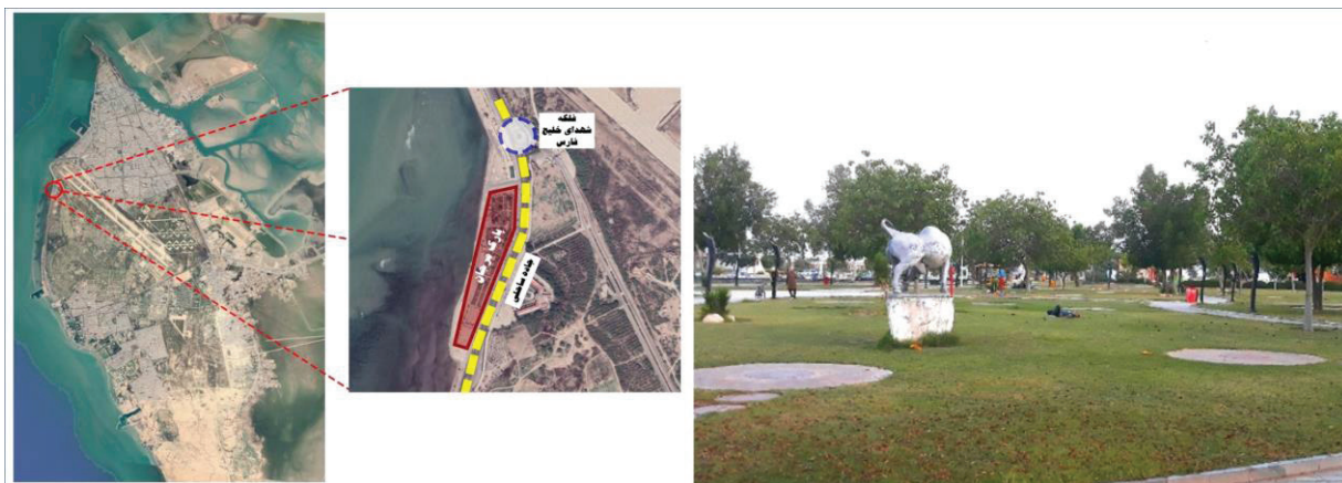
شکل ۳- تصویر و موقعیت پارک مرجان در شهر بوشهر

پارک شغاب: این پارک در بخش جنوبی شهر بوشهر (منطقه ۲) و در محله شغاب قرار گرفته است. پارک شغاب در حدود ۱۲۴۹۱۶ مترمربع مساحت دارد و بزرگ‌ترین پارک بوشهر است. قرارگیری این پارک در کنار ساحل و داشتن چشم‌اندازی زیبا، وجود امکانات نسبتاً مناسب برای گردشگران و مساحت زیاد فضای سبز باعث شده تا این پارک از محبوبیت بالایی برخوردار باشد (شکل ۴).