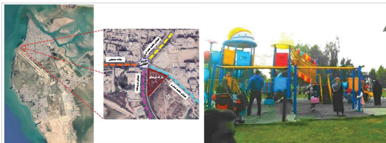
شکل ۲- تصویر و موقعیت پارک بن مانع در شهر بوشهر

پارک بن مانع: این پارک در بخش شمالی شهر بوشهر (منطقه ۱) و در محله بن مانع قرار گرفته است. پارک بن مانع حدود ۱۰۱۵۴ مترمربع مساحت دارد. این پارک به دلیل نزدیکی با سه خیابان شریانی فرودگاه، شهید چمران و ساحلی از اهمیت خاصی برخوردار است (شکل ۲).