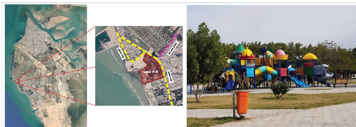
شکل ۴- تصویر و موقعیت پارک شغاب در شهر بوشهر

پارک شغاب: این پارک در بخش جنوبی شهر بوشهر (منطقه ۲) و در محله شغاب قرار گرفته است. پارک شغاب در حدود ۱۲۴۹۱۶ مترمربع مساحت دارد و بزرگ‌ترین پارک بوشهر است. قرارگیری این پارک در کنار ساحل و داشتن چشم‌اندازی زیبا، وجود امکانات نسبتاً مناسب برای گردشگران و مساحت زیاد فضای سبز باعث شده تا این پارک از محبوبیت بالایی برخوردار باشد (شکل ۴).