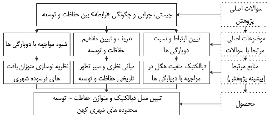
شکل ۱ - نمایش ارتباط منابع اصلی و پیشینه پژوهش در دستیابی به مدل دیالکتیک و متوازن حفاظت - توسعه محدوده‌های شهری کهن

فیلسوف عصر روشنگری (کهن، ۱۹۹۶) و هگل به عنوان مهم‌ترین فیلسوف مدرنیته (هابرماس، ۱۹۸۵ به نقل از جهانگل، ۲۰۱۳) به شیوه‌ای نظام‌مند به تبیین ماهیت و رابطه دویارگی‌ها پرداخته‌اند. و بویژه هگل با تدوین یک متدولوژی قدرتمند چارچوب عقلانی کارآمدی برای تبیین و حل تناقض‌های عقلی ارائه کرده است. (جهانگل، ۲۰۱۳) لذا این مقاله در یک پژوهش میان پارادایمی بین سه منبع اصلی «نظریه نوسازی متوازن بافت‌های فرسوده شهری»، «ادبیات نظری حفاظت و توسعه شهری» و «مدل دیالکتیک منفیت» در مواجهه با دویارگی‌ها و با هدف رفع تعارض و ایجاد ارتباط متعامل و هم‌افزا بین دو انگاره حفاظت و توسعه، در «تبیین مدل دیالکتیک و متوازن حفاظت - توسعه محدوده‌های شهری کهن» تلاش نموده است. در شکل ۲ چگونگی ارتباط منابع اصلی و پیشینه پژوهش در تدوین اهداف و دستیابی به مدل دیالکتیک و متوازن حفاظت - توسعه محدوده‌های شهری کهن نمایش داده شده است.