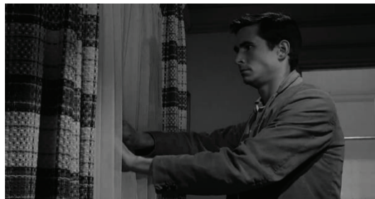
تصویر شماره ۲: نمونه القای فضای ترس به کمک پنجره