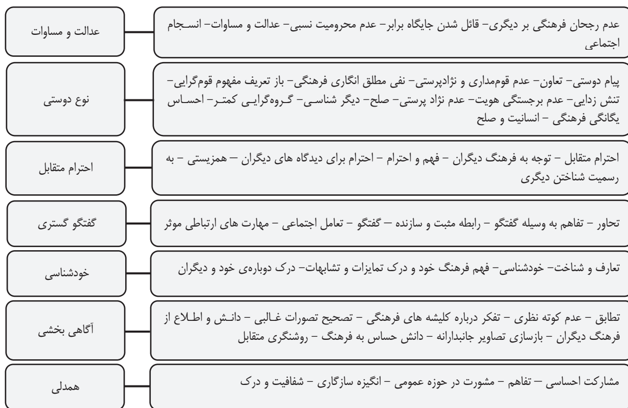
تصویر ۱- دسته‌بندی معیارهای استخراج شده مربوط به تعاملات بین‌فرهنگی